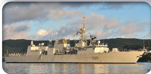
加拿大「蒙特婁號」航向印太區域，支援「霓虹行動」。