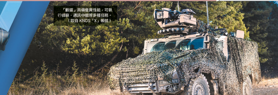
「豹貓」具備優異性能，可執行偵察、通訊中繼等多種任務。(取自 KNDS「X」帳號)

「獅鷲」車內空間寬，因此衍生多種構型，支援相應任務。(取自 KNDS「X」帳號)