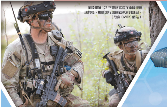
美陸軍第 173 空降旅官兵在傘降抵達瑞典後，接續進行城鎮戰等演訓課目。