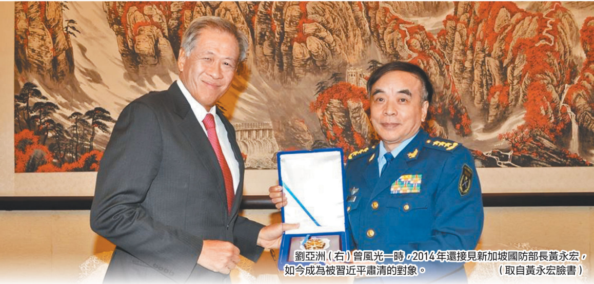
劉亞洲(右)曾風光一時，2014年還接見新加坡國防部長黃永宏，如今成為被習近平肅清的對象。

1980年代中共開始改革開放後，這些多少都經歷過文化大革命等系列政治運動的紅二代，多已長大成人，他們不一定克紹箕裘，進入黨、政、軍系統發展，更多的是趁著「改革開放」，出現眾多有利可圖新行業發展的時機，在中共權力庇蔭下，藉各類型國有企業搶占各領域壟斷利基；他們掌握各種投資、開發、政策條件等內線資訊，同時享有在各級政府政治審批快速通關的便利，而在1990年代逐漸形成盤根錯節的「紅色利益集團」，一方面控制中共經濟命脈，一方面也形成專屬於中共的政經分贓體系，以使充滿政治權力、財富利益的