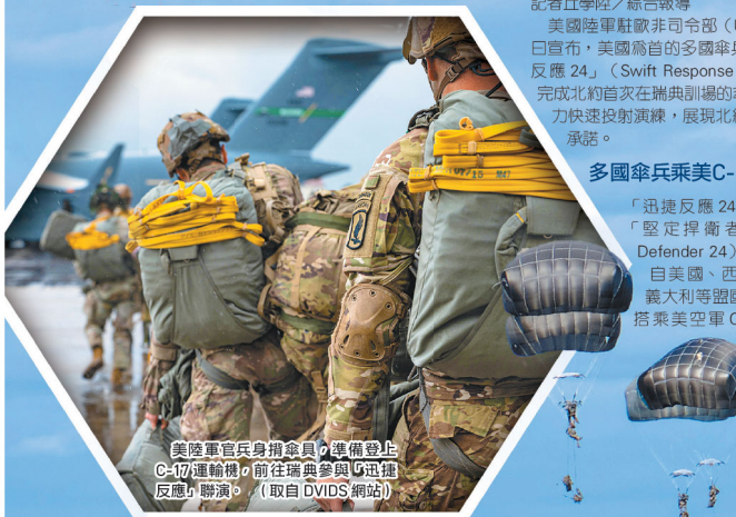
美陸軍官兵身攜傘具，準備登上 C-17 運輸機，前往瑞典參與「迅捷反應」聯演。