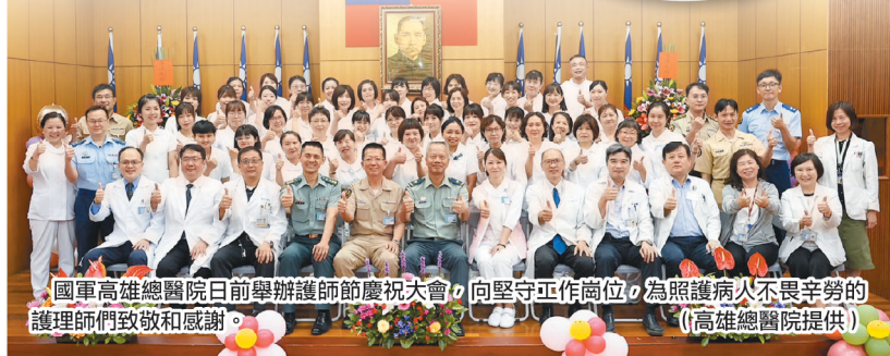
國軍高雄總醫院日前舉辦護師節慶祝大會，向堅守工作崗位，為照護病人不畏辛勞的護理師們致敬和感謝。

（本報訊） 針對媒體報導「阿兵哥喝醉酒嗨跳街舞上傳抖音」乙情，陸軍教育訓練暨準則發展指揮部昨日表示，經查其中1員確曾於空訓中心服軍事訓練役，但已於今年2月停役。為釐清案況主動聯繫，該員自述畫面中均為其友人，並非現役軍人，且拍攝地點為家中，並非營區。 陸軍教準部表示，影片中穿著軍服者疑未具軍人身分，且服儀不整，另影片標註「國軍兄弟跳街舞」，已嚴重影響國軍形象，混淆社會視聽；教準部表達譴責，並已主動提供影片向屏東憲兵隊告發，釐清是否涉法。