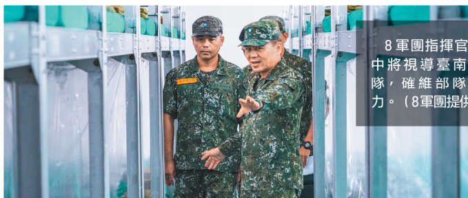
8軍團指揮官呂中將視導臺南部隊，確維部隊戰力。

其次，接訓單位針對官兵訓練用的器材、裝備，要完成檢整及換補，以展現裝備精良、訓練有素之國軍戰士，進而提升招募成效。最後，執行各項訓練，應以「安全」為首要考量，確依程序、步驟、要領，並完善風險管控作為，確保人員在安全無虞的狀況下執行訓練，以達實戰化訓練目標。