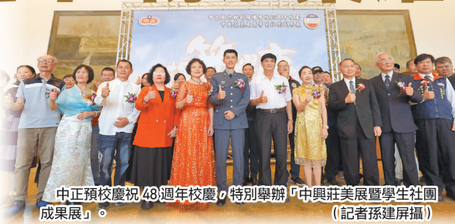
中正預校慶祝 48 週年校慶特別舉辦「中興莊美展暨學生社團成果展」。

此外，今日的校慶活動也將有鼓號樂隊校友團、陸軍官校、空軍官校、樹德家商、高雄高商、三民家商、小港高等演出，並邀請學生家長參加班級親師座談