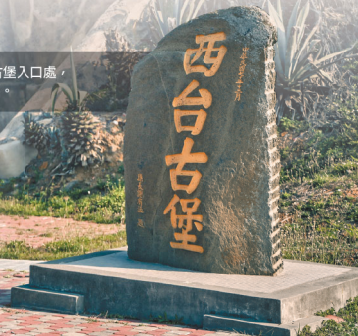
澎湖西嶼西臺古堡入口處， 石碑見證歷史軌跡。

特別的是，砲臺三面懸崖峭壁，堡內通風、採光相當良好，登上拱形甬道，環顧四周、俯瞰海洋，猶能感受當年守軍捍疆衛土的雄風，這座砲臺不僅是軍事古蹟，更是東亞地區軍事關係的歷史見證。