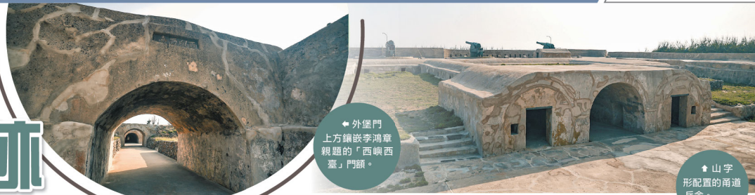
外堡門 上方鑲嵌李鴻章親題的「西嶼西臺」門額。