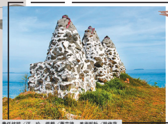
責任編輯／汪珍 編輯／蕭文德 美術設計／歐佳琦

外垵村三仙塔分為東、西三仙塔兩處。東三仙塔已被周圍銀合歡覆蓋，西三仙塔位於村落西側，矗立於山崖上，周圍更有幾座小型砲壘及燒磚廠，位置居高臨下俯瞰整個外垵村；三仙塔所在位置即為外垵村制高點，將外垵美景盡收眼底，隨夕陽西下，更增添幾分色彩。