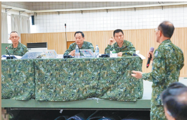
6軍團指揮官李中將主持軍務會報，期戮力戰訓本務。

李指揮官表示，實兵演習將屆，各單位應藉電腦兵推經驗與檢討，以「平戰結合、為戰而訓」為目標，深刻了解敵、我軍能力與限制，強化責任地境環境、人員訓練、裝備維修等各項整備，務實全般規劃，確保戰訓任務順遂；另叮囑各單位，持恆要求駐地訓練及軍紀安全，落實日常工作推動，奠定基礎，確保部隊在「安全」前提下，完成各項訓練，維繫部隊戰力。