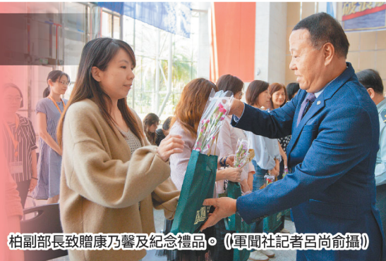
柏副部長致贈康乃馨及紀念禮品。

柏副部長表示，母親節最大的意義，是希望大家不要忘了表達對母親的養育之恩，國軍多數女性同仁，扮演職業婦女的角色，身兼數職，除了工作之外，也要兼顧家庭，這相當令人感佩，也值得所有人尊敬與表揚。在母親節前夕，他也特別祝賀所有女性夥伴平安健康、青春美麗，一切順心如意。