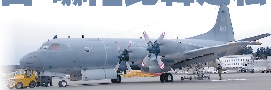
加拿大 CP-140 巡邏機，日前啟程赴日執行「霓虹行動」。

除 CP-140 外，加拿大還宣布皇家加拿大海軍巡防艦「蒙特婁號」(FFH 336)，已搭載 1 架 CH-148 直升機航向印太區域，準備支援「霓虹行動」。加國自 2018 年以來，已進行 11 次類似行動，且加拿大政府 2023 年宣布，將延續「霓虹行動」至 2026 年 4 月，維繫國際對北韓制裁強度。