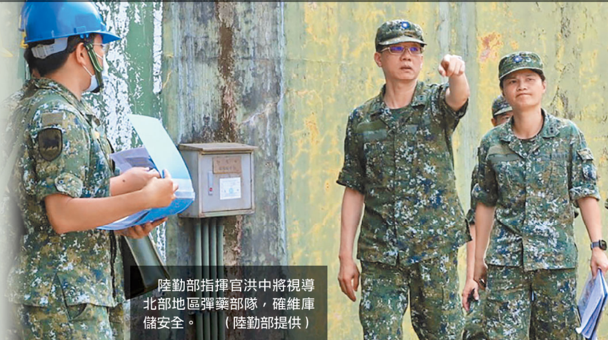
陸勤部指揮官洪中將視導北部地區彈藥部隊，確維庫儲安全。

洪指揮官強調，為防範工安事件，單位平時應教育幹部防險觀念，並藉督管各項作業細節，進而提升作業場域安全，順利完成勤支任務；同時要求運用建制組織主動掌握人員心緒，協助解決疑難與窒礙，共同維護單位團結榮譽。