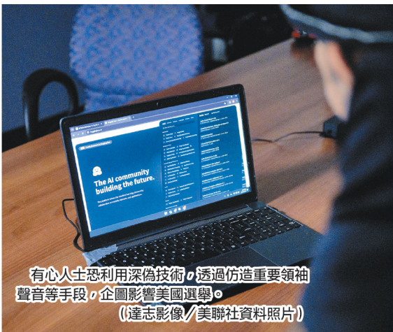
有心人士恐利用深偽技術，透過仿造重要領袖聲音等手段，企圖影響美國選舉。

不只美國，去年 10 月斯洛伐克國會選舉前夕，社群媒體也傳播疑似自由派領袖的首訊片段，內容談論提高啤酒價格與操縱選票等。經調查，音訊是利用深偽技術捏造。