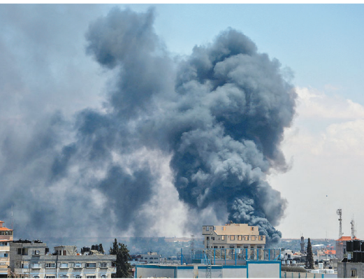
以色列堅持揮軍拉法，近日已開始轟炸該市周邊。