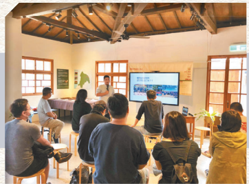
↑ 將軍村舉辦各項課程、工作坊及論壇，讓民眾在此嘗試多元體驗。