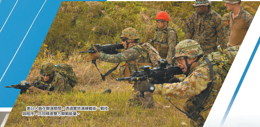
美日人員在聯演期間，透過實地演練戰術、戰技與程序，共同精進雙方聯戰能量。