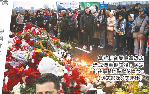
莫斯科音樂廳遭恐攻造成慘重傷亡後，民眾前往事發地點獻花悼念。

對此，烏國智庫「反假訊息中心」(Center to Counter Disinformation)直言，俄國高層可能將恐攻責任嫁禍烏國，進而為日後擴大徵兵、動員塑造合理藉口。俄國反對派人士則以「第二次車臣戰爭」前，莫斯科發生多起爆炸事件、造成大批平民傷亡，讓蒲亭以此為由發動「第二次車臣戰爭」為例，批評蒲亭意圖再次重施故技，藉此鞏固政治地位與權力。