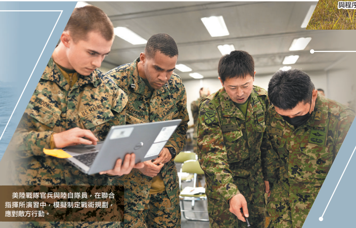
美陸戰隊官兵與陸自隊員，在聯合指揮所演習中，模擬制定戰術規劃，應對敵方行動。