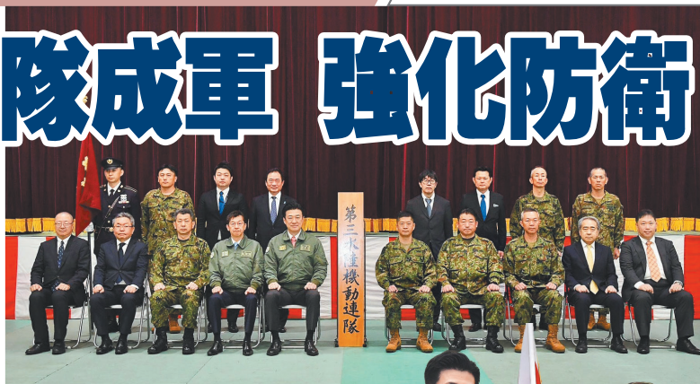
▲ 第 3 水陸機動連隊未來將部署在長崎，負責強化西南島嶼的防衛任務。（取自防衛省「X」帳號）

根據相關報導指出，松竹駐屯地除第 3 水陸機動連隊之外，還部署了陸自西部方面隊（相當於軍團指揮部）所轄高射特科群（防空飛彈群）、通信群等單位，且該基地位置鄰近海上自衛隊大村航空基地，未來可因應相關作戰或突發事件需求，搭配日後進駐的陸自「輸送航空隊」，透過 V-22「魚鷹」傾斜旋翼機，執行快速武力投射任務，有效維護區域穩定。