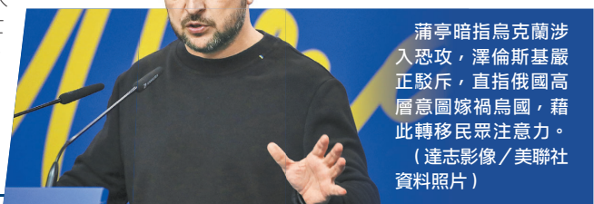
蒲亭暗指烏克蘭涉入恐攻，澤倫斯基嚴正駁斥，直指俄國高層意圖嫁禍烏國，藉此轉移民眾注意力。