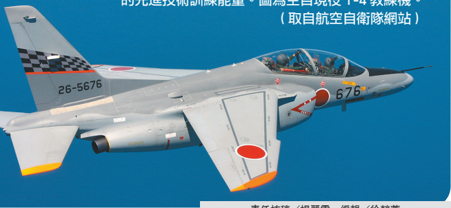
責任核稿／楊麗雲 編輯／徐懿堂