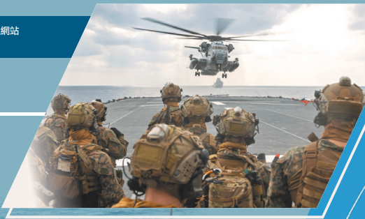
CH-53 直升機準備降落「國東號」飛行甲板，載運陸戰隊員模擬對可疑海上目標執行登船與扣押（VBSS）課目。