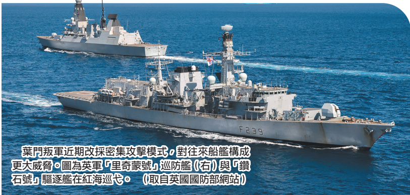
葉門叛軍近期改採密集攻擊模式，對往來船艦構成更大威脅。圖為英軍「里奇蒙號」巡防艦(右)與「鑽石號」驅逐艦在紅海巡弋。