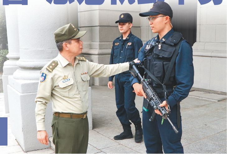
憲指部指揮官鄭禎祥中將視導憲兵211營官兵，慰勉執勤辛勞。

最後，鄭指揮官強調，各級幹部應妥善官兵生活照顧及勤務規劃，運用組織掌握所屬心緒狀況，確保部隊戰力；同時期勉官兵以身為「天下第一營」為榮，建立三信心，信仰長官、信任部屬，自信其成為忠貞勇敢憲兵。