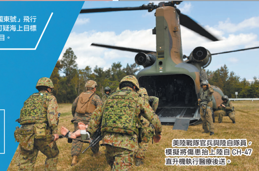
美陸戰隊官兵與陸自隊員，模擬將傷患抬上陸自CH-47直升機執行醫療後送。