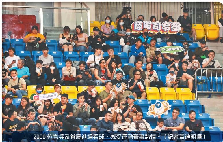
2000 位官兵及眷屬進場看球，感受運動賽事熱情。

另在觀眾席上，隨處可以看見官兵、眷屬拿著「政治作戰局與你並肩作戰」、「軍人之友社為你加油」、「我愛空軍」等加油看板，為場上球員奮力防守、掌握契機得分的拚勁加油，如同陸軍健兒固守前線，空軍飛行官升空應處共機，海軍官兵緊急出港監控越界船艦，為臺北戰神加持戰力，全力應援。