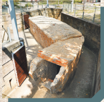
↑ 園區內保留舊時防空洞，供民眾解過去特殊時空背景下，所建構的特殊地景。