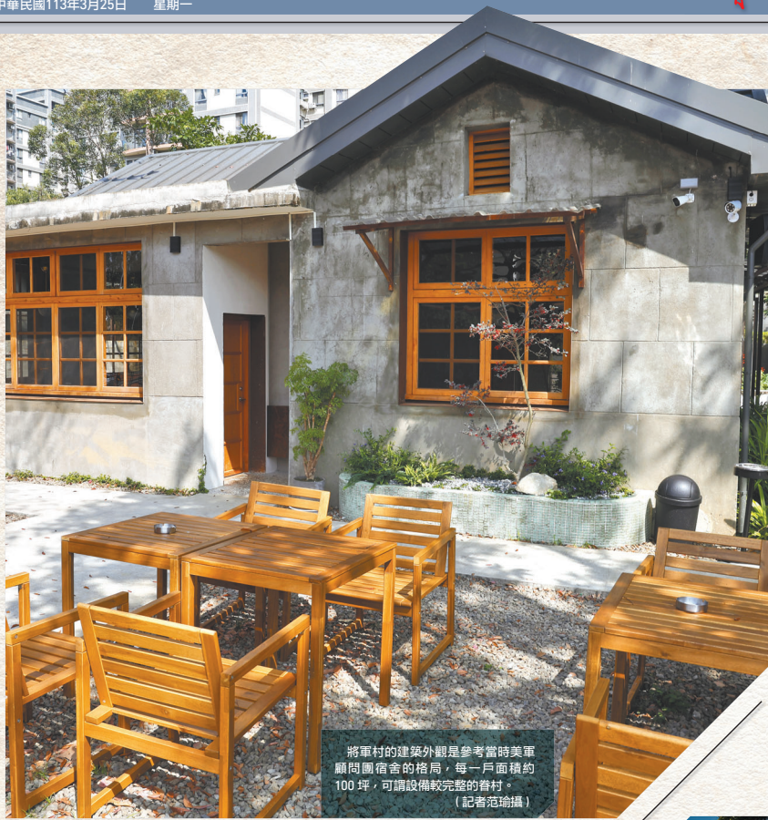
將軍村的建築外觀是參考當時美軍顧問團宿舍的格局，每一戶面積約100坪，可開設設備較完整的眷村。