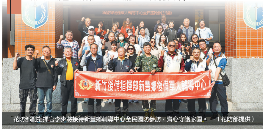
花防部副指揮官李少將接待新豐鄉輔導中心全民國防參訪，齊心守護家園。

李副指揮官表示，輔導組織平時戮力執行後備軍人組織、宣傳、安全及服務工作，成效有目共睹，此次參訪活動，更是以行動力展現支持全民國防政策的決心，希望秉持既有良好的互動及聯繫，持續支持國軍及推展全民國防工作，共同守護美好家園。