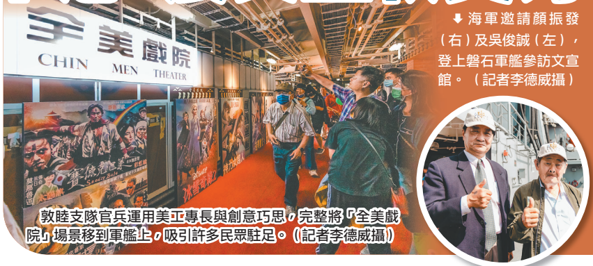
敦睦支隊官兵運用美工專長與創意巧思，完整將「全美戲院」場景移到軍艦上，吸引許多民眾駐足。(記者李德威攝)

容包含「賽德克巴萊」、「捍衛戰士2：獨行俠」等國內外電影海報，透過支隊官兵運用美工專長與創意巧思，完整將「全美戲院」場景移到軍艦上，搭配一旁「磐石柑仔店」木作設計及懷舊古玩，讓民眾體認臺灣時代演進歷程與優異藝文軟實力。