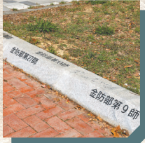
↑ 在將軍村停車場的步道上，可見曾居住於此的領導幹部及家眷專屬的單位。