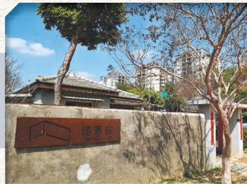
↑ 將軍村原名金城新村，昔日為「陸軍金門防衛司令部」高階將領的住所。

此外，將軍村也舉辦各項課程、工作坊及論壇，無論是科技、農食、工藝、瑜珈等課程，都能在此體驗嘗試，讓學習輕鬆地融入生活之中。每屆週末亦舉辦市集，由營運團隊自行招募或是其他市集品牌進駐，透過民眾熱情參與，共同形塑生活願景，延續眷村人情味。