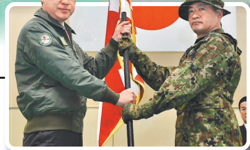
▶ 日本防衛大臣木原稔 24 日為第 3 水陸機動連隊（團級）主持授旗儀式，宣示強化防衛戰力決心。