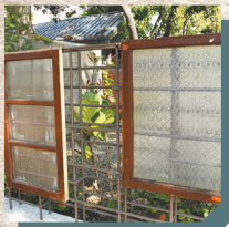
↑ 復古舊窗戶已成為將軍村圍牆上的點綴。