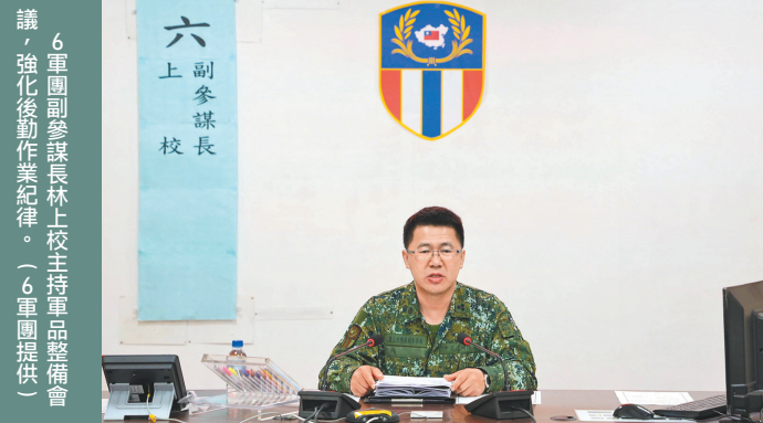
6軍團副參謀長林上校主持軍品整備會議，強化後勤作業紀律。

林副參謀長強調，裝備妥善與部隊戰力密不可分，各級幹部應持續落實後勤教育訓練，培養專業職能，恪遵後勤作業紀律，落實風險管控，並確依標準作業程序執行各項維保任務，鞏固部隊整體戰力；另叮囑各級應持恆強化所屬行車安全觀念，降低「應注意而未注意」事件肇生，確維單位安全。