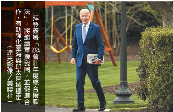
拜登簽署「2024 會計年度綜合撥款法」，將繼續軍援我國，並促進合作，有助強化臺海與印太區域穩定。