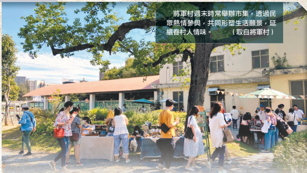
將軍村週末時常舉辦市集，透過民眾熱情參與，共同形塑生活願景，延續眷村人情味。