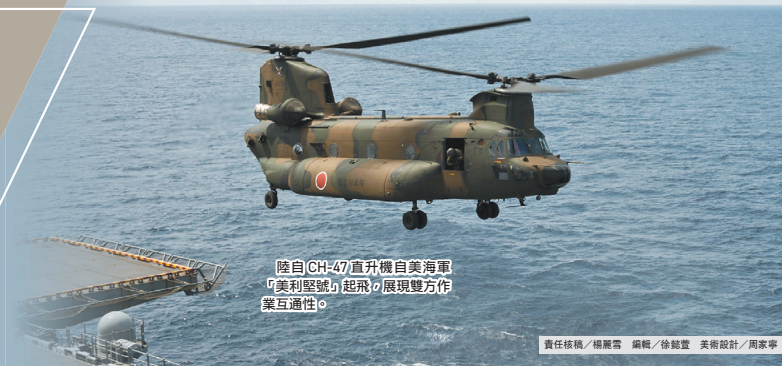
陸自CH-47直升機自美海軍「美利堅號」起飛，展現雙方作業互通性。