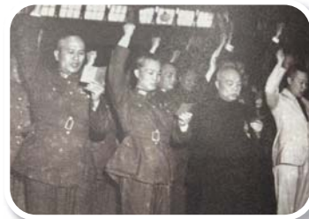
國防部成立時，首任國防部長白崇禧（左1）進行宣誓就職。

9月初，第4戰區遭日軍多點突破，戰至11日時，桂林城內2000餘守軍全部陣亡，31軍131師師長關維雍少將拒絕撤退，於陣地內舉槍自戕忠烈殉國，桂林淪陷。（記者劉佩倩輯；資料來源：陸軍司令部、《鐵血映丹心 九十星霜止戈留芳》）