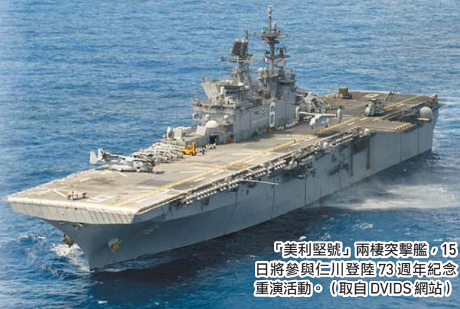
「美利堅號」兩棲突擊艦，15日將參與仁川登陸73週年紀念重演活動。

仁川登陸行動於1950年9月15日展開，麥克阿瑟率領的聯合國部隊，透過在仁川的大膽登陸作戰，於兩週內重奪首爾，並切斷當時圍攻金山的北韓軍隊補給線，讓南韓轉危為安。南韓軍方曾多次舉辦類似登陸重演活動，紀念扭轉韓戰局勢的關鍵一役。