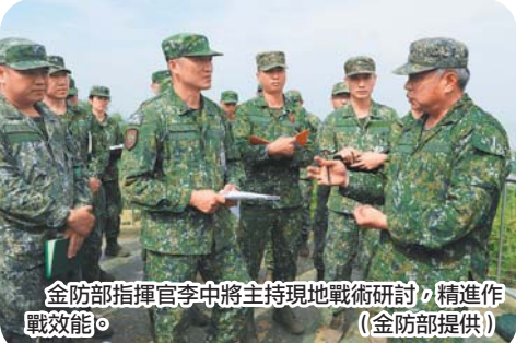
金防部指揮官李中將主持現地戰術研討，精進作戰效能。

金防部指揮官李中將昨日主持現地戰術研討，過程中聽取各部隊任務簡報，並充分討論，研析戰術價值及兵力運用規劃，以精進整體作戰效能。李指揮官表示，現地戰術旨在讓各級部隊熟稔戰場環境，並依當前敵情威脅變化及敵戰術戰法變革，深入研析敵可能行動，務實檢討實際可能面臨的作戰景況與空礙，以預為因應。最後，李指揮官強調，各部隊平時即應落實臨戰訓練，使官兵熟稔作戰任務與戰場環境，並強化戰場經營實效，方能提升部隊實戰能力。