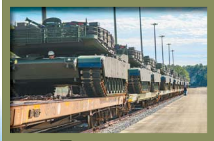
▲美軍正在逐步換裝 M1A2 SEPv3，並預定在 2030 年代換裝 M1E3。