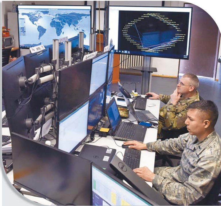
國際空間連結戰鬥網路、支援情報傳遞與交換資訊，重要性與日俱增，美軍也定期舉辦網路防禦演習，強化相關能力。

應歸功於衝突前支持發展與推行國家網路戰略的相關行動；此外，外國政府於開戰初期協助烏國，應對網路侵入活動的努力與成果，亦不容忽視。