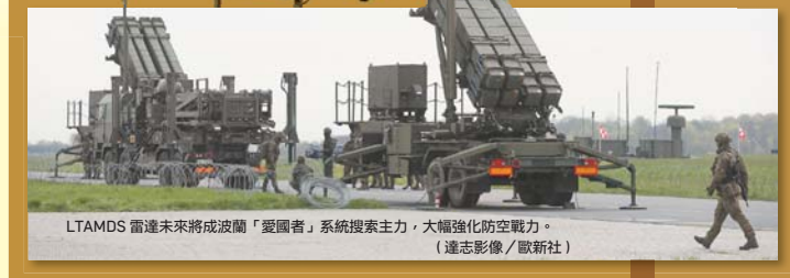
LTAMDS 雷達未來將成波蘭「愛國者」系統搜索主力，大幅強化防空戰力。