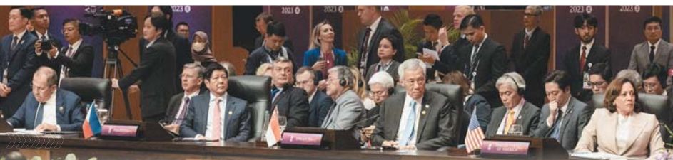
賀錦麗（右1）與拉夫羅夫（左1），在東亞峰會罕見同臺。