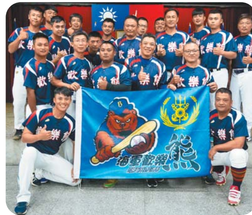
海軍艦指部指揮官蔣中將主持「歡樂熊壘球隊」參加「2023 第 21 屆總統盃全國慢速壘球錦標賽」授旗儀式，期勉爭取最高榮譽。

海軍艦指部指揮官蔣中將昨日主持「歡樂熊壘球隊」授旗儀式，該隊由海軍所屬各艦隊聯合組成，將參加第「2023 第 21 屆總統盃全國慢速壘球錦標賽」，盼透過競賽激發團體榮譽心，爭取最高榮譽。蔣指揮官為「歡樂熊壘球隊」授旗並頒發團體獎金，鼓舞選手士氣，希冀發揮平日訓練，展現精湛球技，並秉「堅持到底」的運動家精神，全力以赴，為艦隊爭取佳績；儀程最後，蔣指揮官與代表隊選手們合影，預祝旗開得勝，凱旋歸來。