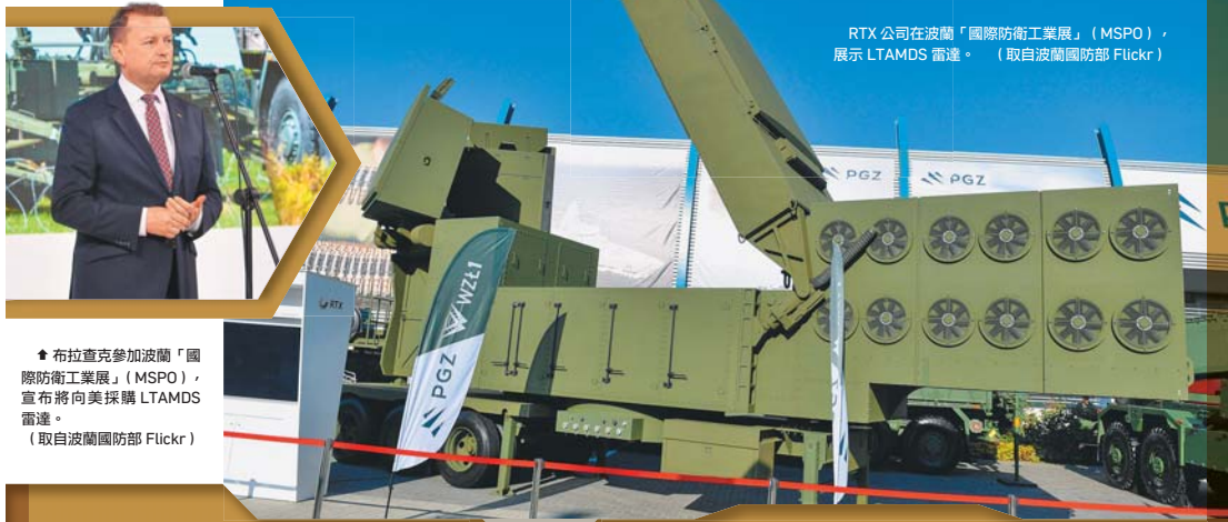
RTX公司在波蘭「國際防衛工業展」(MSPO)，展示 LTAMDS 雷達。