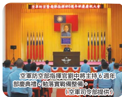
空軍防空部指揮官劉中將主持6週年部慶典禮，勉落實戰備整備。

最後，劉指揮官提出「落實戰備演訓」、「多元教育管道」、「健全心理衛生」及「確遵軍紀要求」等4點與官兵共勉，期許各單