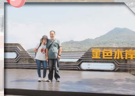
▲金色水岸廣場是遊客照打卡熱門景點。