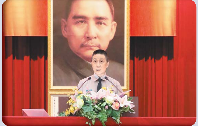
國防大學校長劉志斌上將主持 112 學年度基礎學院開學典禮，勉追求卓越。

劉校長最後以「勇敢面對挑戰，追求卓越人生」勉勵同學們，強調學習過程中難免遭遇種種困難或挫折，然而每次挑戰都是淬鍊成長的機會，唯有堅持不懈地學習、永不放棄的信念，方能成就更高的目標；另期勉在新的學期中，訂定一套開創自我價值的具體計畫，並且用積極進取的態度，勇於追求理想，不斷超越極限，成為內心強大、足堪重任的棟梁之材。