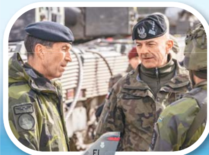
波蘭呼籲北約，積極應對俄國核武威脅，以免形成骨牌效應。圖為安德萊伊察克（右）視導波蘭與瑞典聯合演習。

戰略轟炸機巡弋東歐，嚇阻俄國與白俄羅斯蠢動。圖為波蘭 F-16 與美軍 B-1B 轟炸機編隊飛行。