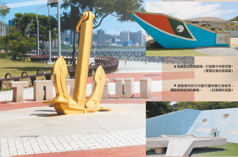
▲艦船造型遊戲場，打造親子休憩空間。