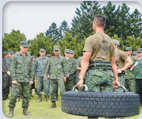
陸軍司令鍾樹明上將主持「強化部隊訓練示範」，期全面優化三軍地面部隊訓練模式。

「為戰而訓、戰訓合一」，鍾司令表示，各級部隊應落實戰場情報準備，依作戰進程修訂計畫，並據以擘劃訓練要項，精進訓練模式及戰術戰法，以肆應現代化戰爭型態。此外，配合戰演訓時機驗證單位指管系統，以「通信鏈」串連「情報鏈」、「指揮鏈」，進而建立「擊殺鏈」，再透過完備的「後支力」，協力主戰部隊達成作戰任務，達「軍種聯合、兵種協同」之目標，確保臺海和平與安全。