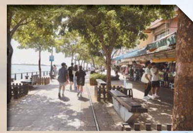
▲走進淡水老街，遊客除能一覽沿岸美景，還可品嚐在地美食。

此外，淡水老街亦有眾多美食料理，例如阿婆鐵蛋、阿給、魚酥等，讓民眾能夠大飽口福，同時也有前往八里的渡輪，民眾可自行安排遊程，選擇步行或租腳踏車、協力車，輕鬆愜意的遊賞淡水風光，同時回顧「軍事風情」。