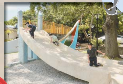
▲孩童在觀潮廣場的磨石子滑梯，玩得不亦樂乎。