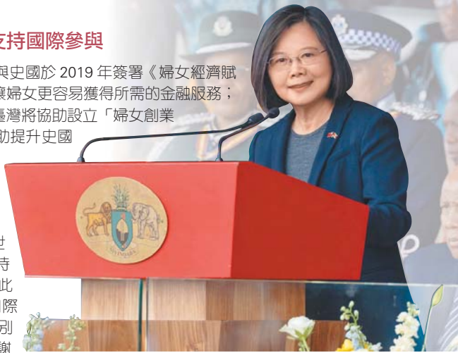
蔡總統出席史國雙慶典禮，感謝史國為臺仗義執言。

蔡總統強調，在堅定挺臺的史國友人面前，要藉此機會感謝史國支持臺灣參與國際組織。其中，恩史瓦帝三世曾在去年的聯合國大會上支持臺灣有意義參與國際組織；此外，該國總理戴克禮也在國際場域為臺灣仗義執言。「特別要代表臺灣人民和政府，感謝大家並盼持續支持！」