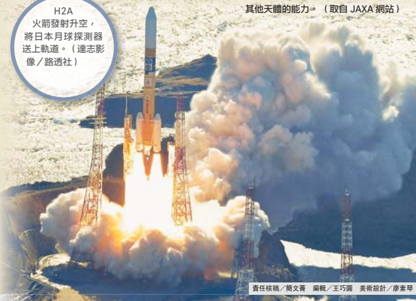
責任編輯／高文青 編輯／王巧圓 美術設計／廖素琴