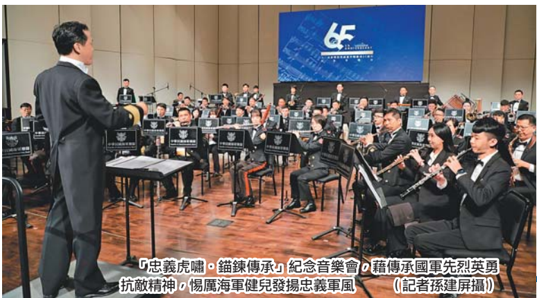
「忠義虎嘯·錨鍊傳承」紀念音樂會，藉傳承國軍先烈英勇抗敵精神，惕厲海軍健兒發揚忠義軍風。