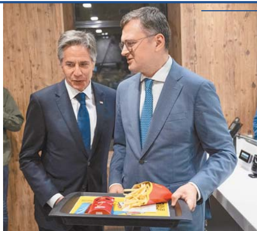
美國國務卿布林肯（左）與庫列巴，前往基輔麥當勞享用薯條，凸顯烏國人民的生活逐漸恢復正常。