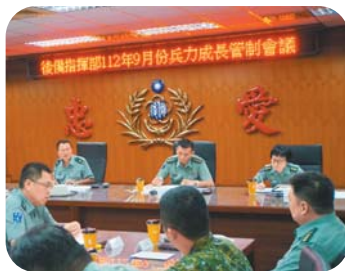
後備指揮部參謀長薛少將主持兵力成長管制會議，期厚植後備戰力。