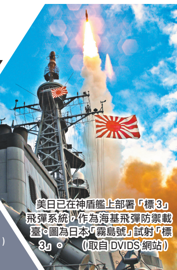
美日已在神盾艦上部署「標 3」飛彈系統，作為海基飛彈防禦載臺。圖為日本「霧島號」試射「標 3」。