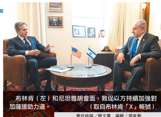
布林肯(左)和尼坦雅胡會面，敦促以方持續加強對加薩援助力量。

布林肯隨後在以國防長葛朗特，以及聯合國駐加薩協調官卡格陪同下，前往位於以色列與埃及邊境的克瑞沙洛過境點參訪。他表示美軍正在趕工搭建的臨時浮動碼頭，預計1週後就可投入使用，屆時將能運送更多援助資源，改善難民生活處境；他直言，人道援助雖有正面進展，但考量加薩人民巨大而迫切的需求，相關補強舉措必須加速且持續進行。