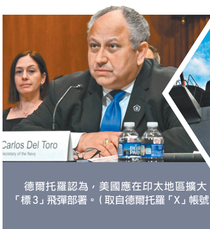
德爾托羅認為，美國應在印太地區擴大「標 3」飛彈部署。

40 枚 SM-3，將搭配世宗大王級第 2 批次 (KDX-3 Batch-2) 神盾驅逐艦，強化南韓彈道飛彈防禦能力。