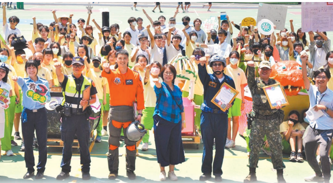
空軍飛訓部走入校園，推廣全民國防教育。