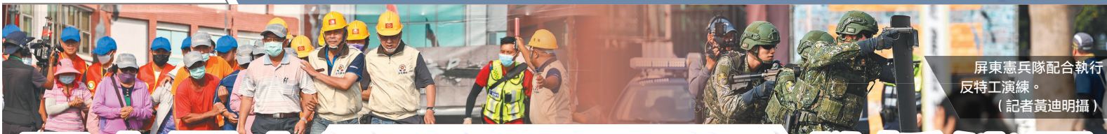
屏東憲兵隊配合執行反特工演練。