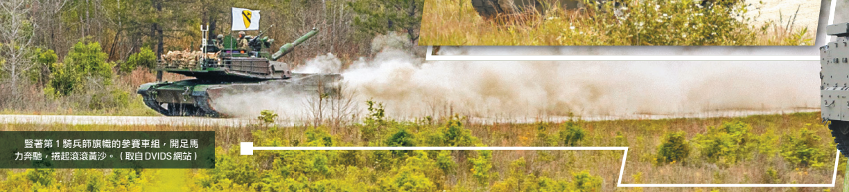
暨著第1騎兵師旗幟的參賽車組，開足馬力奔馳，捲起滾滾黃沙。