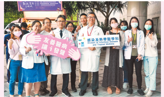
不到病毒時不具傳染力，以促進疾病平權觀念，推動愛滋友善醫病關係。

三總院長洪少將出席響應活動時表示，希望透過醫護與患者在活動中的良好互動，減少過去大眾對於愛滋感染者的偏見與歧視，傳遞愛滋感染者「U=U」測