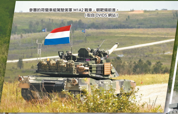
參賽的荷蘭車組駕駛美軍M1A2戰車，朝靶場前進。