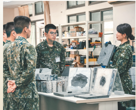
↑土木工程學系以戰力保存思維，研發抗彈性能建材，裨益國軍建軍備發展。

陸軍官校除以戰備訓練思維作為教學的重要核心，也透過校際與國際交流機制，拓展學生視野，培養國際觀，並在教學發展中心的輔助下，持續優化教學師資，厚植教研能量，並以「哲學、科學、兵學」及「思想、武德、武藝」等教學重點設計課程，打造全人教育，培育國軍中堅領導幹部。