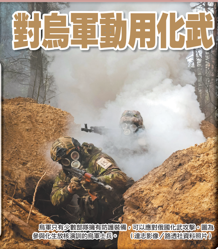
烏軍只有少數部隊擁有防護裝備，可以應對俄國化武攻擊。圖為參與化生放核演訓的烏軍士兵。

「氯化苦」正式化學名稱為「三氯硝基甲烷」，曾被用於第一次世界大戰戰場上；其對眼睛、皮膚與肺部有強烈刺激性，也會讓中毒者呼吸困難、嚴重嘔吐與腹瀉，甚至導致肺炎、肺水腫等疾病，已被OPCW明確禁用。