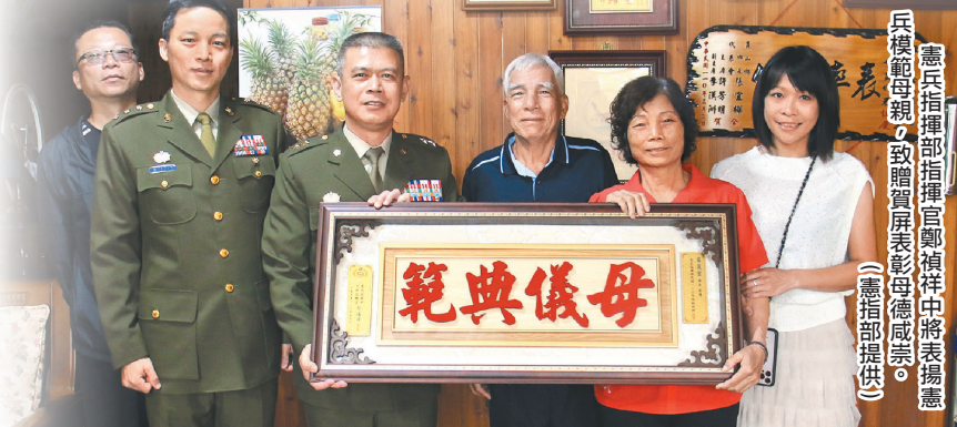
憲兵指揮部指揮官鄭禎祥中將表揚憲兵模範母親，致贈賀屏表彰彰德成崇。

最後，鄭指揮官也期勉每位憲兵同仁，謹行孝道，在工作崗位持續努力，為自己及家庭創造更多榮耀，以回饋母親無私奉獻的愛，並祝福全體母職同仁「母親節快樂」。