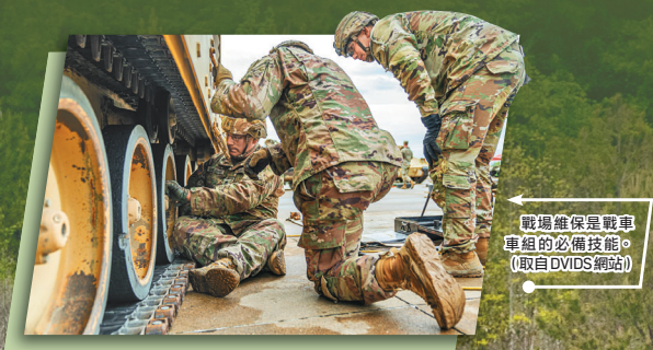
戰場維修是戰車車組的必備技能。