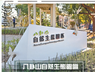
八卦山自然生態園區

彰化縣政府城觀處採自然工法，營造「自然生態園區」，於今年重啟，不僅有縣內公園滑道落差最大的溜滑梯，2.2公頃園區遠串聯「映日池」、「觀月池」、「夕霧綠坡」、「天空之鏡」、「幽谷綠園」等詩意盎然的綠林、花園與交誼廣場，是親子最愛，也吸引旅人徜徉、尋幽。