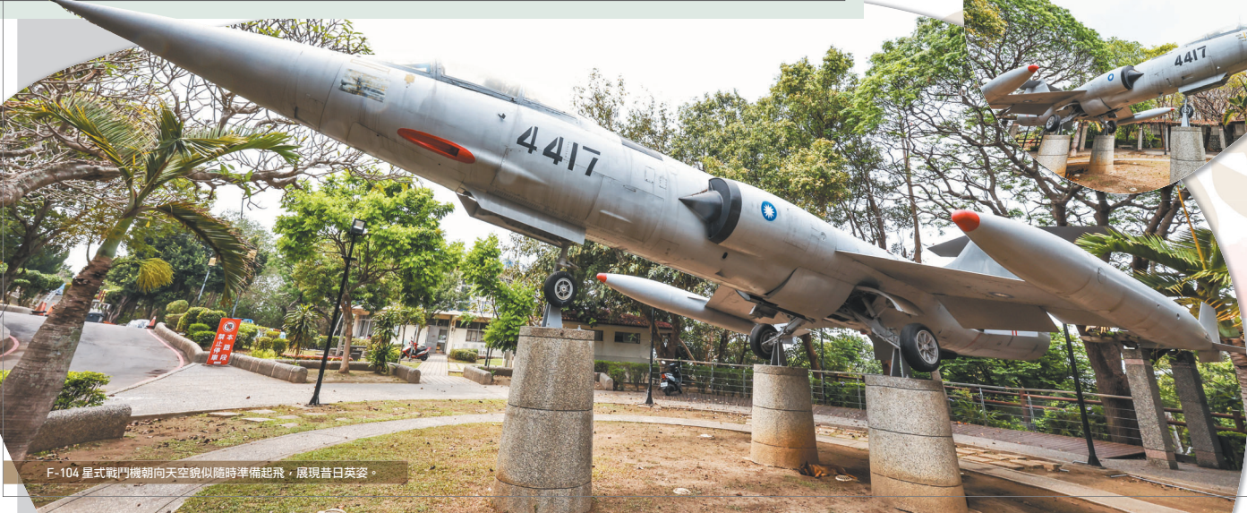
F-104星式戰鬥機朝天空貌似隨時準備起飛，展現昔日英姿。