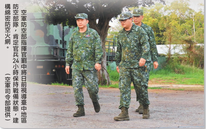
空軍防空部指揮官劉中將日前視導臺中地區防空部隊，肯定官兵24小時保持戰備狀態，建構綿密防空火網。

劉指揮官表示，防空作戰分秒必爭，隨著裝備性能提升，單位在人員訓練環節必須審慎以待，以「遇危不亂、遇事不懼、遇煩定心」為原則，確實磨練官兵精準追瞄、迅速鎖定與快速殲敵能力，建構防空可恃戰力。