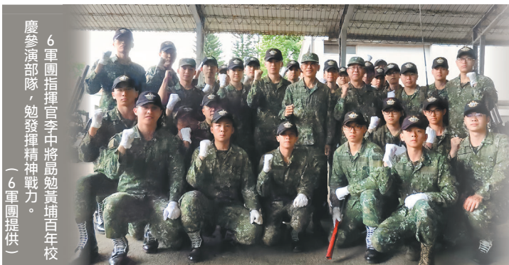
6軍團指揮官李中將蒞臨黃埔百年校慶參演部隊，勉發精神戰戰力。

能參與陸軍官校百年校慶活動，是非常難得且榮耀，期勉參演官兵，體認「犧牲、團結、負責」的黃埔精神，戮力訓練，發揮精神戰戰力，建立使命感與榮譽心。另要求單位，訓練應以「安全」為優先，完善風險管理，防範熱傷害及危安肇生，確保任務圓滿達成。