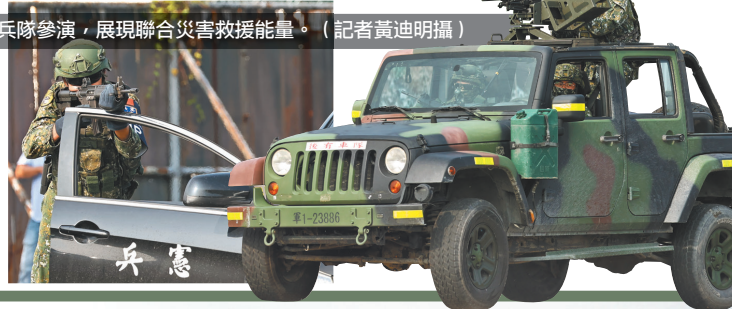
機步333旅、39化學兵群、屏東憲兵隊參演，展現聯合災害救援能量。