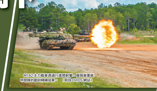
M1A2主力戰車透過進行進間射擊，展現美軍裝甲部隊的動訓精練成果。

「蘇利文盃」於2012年首次舉辦，其競賽名是向裝甲兵科出身的美陸軍上將蘇利文致敬。蘇利文曾在美國陸軍服役36年，擔任多支裝甲部隊指參職務，最終擔任第32任美國陸軍參謀長，後於1995年退役，今年1月2日過世，享壽86歲。