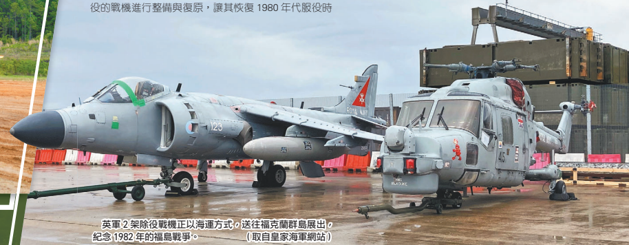
英軍2架除役戰機正以海運方式送往福克蘭群島展出，紀念1982年的福克蘭戰爭。

這2架飛機預計在今年6月抵達福克蘭，並且擬在2025年春季新展覽廳完工後，正式開放參觀。目前福克蘭群島人口不到3千人，但該島博物館每年吸引超過8萬人次遊客。