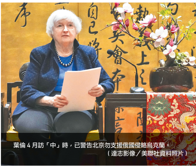
葉倫4月訪「中」時，已警告北京勿支援俄國侵略烏克蘭。