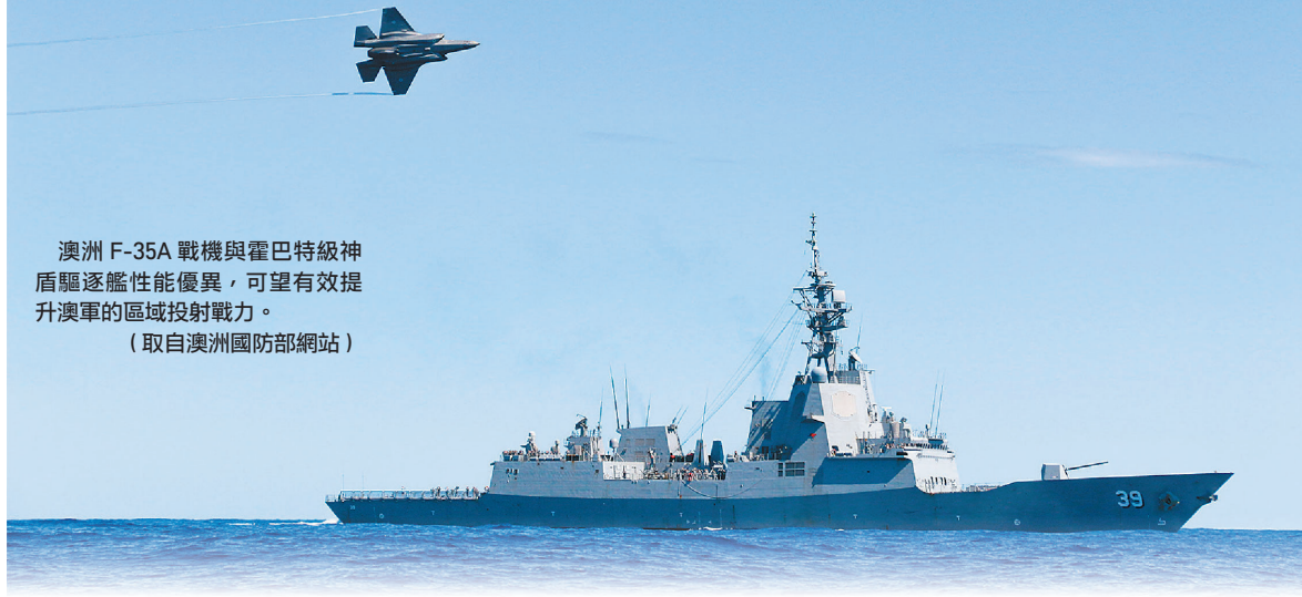
澳洲 F-35A 戰機與霍巴特級神盾驅逐艦性能優異，可望有效提升澳軍的區域投射戰力。

本文以日「中」在東海爭端為例認為，倘若衝突是海上事故等意外引發，其規模將因各方自我克制而有所限縮，真正具風險的部分，是中共透過灰色地帶或其他手段，引發區域衝突並使用有限武力，預期另一方會為避免戰爭爆發風險而退讓，進而造成其擴張的既成事實；但區域內絕大多數國家都與美國簽有共同防禦條約，這將讓美國對這些國家的安全承諾，成為回應中共侵略與衝