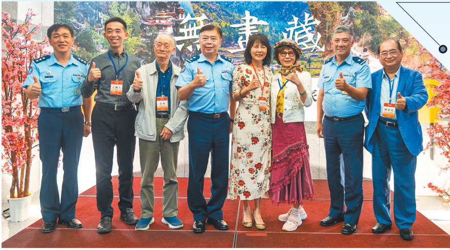
▲空軍司令部政戰主任姜中將主持忠勇藝廊開幕，陶冶官兵藝文涵養。