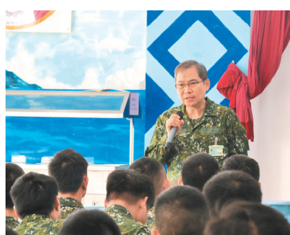
花防部政戰主任謝上校主持軍法紀巡迴宣教，維護部隊榮譽。

謝主任強調，「軍紀安全沒有假期」，透過真實社會案例分析，以及生動活潑的講解，提醒官兵，無論何時均須牢記軍職身分，遵守軍紀要求規定，避免憾事發生，維護部隊榮譽。