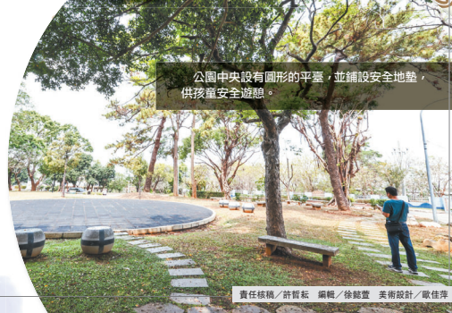
公園中央設有圓形的平臺，並鋪設安全地墊，供孩童安全遊憩。