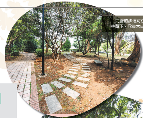
完善的步道可供民眾漫步在林蔭下，欣賞大自然之美。