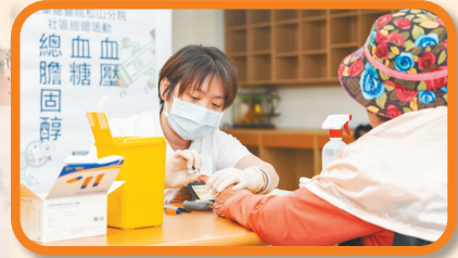
▲ 松山分院醫護人員親切引導長輩們進行血壓、血糖等量測，提供長輩們優質醫療照護。