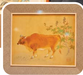
林玉山畫作《黃牛》成功修復，展現保存國家文化資產的成果。