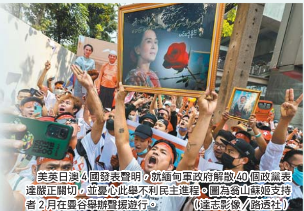
美英日澳4國發表聲明，就緬甸軍政府解散40個政黨表達嚴正關切，並憂心此舉不利民主進程。圖為翁山蘇姬支持者2月在曼谷舉辦聲援遊行。

報導還說，由於當局曾於1月頒布「政黨登記規定」，嚴格限制登記參選政黨黨員人數與候選人資格；之後更於2月1日再次宣布延長國家緊急狀態6個月，而且堅拒公布大選時程，因此遭許多政黨以拒絕登記方式進行抵制。緬甸議題專家則憂心，這項發展恐將進一步激化軍政府與反對派的對立，並引發更大規模的血腥暴力衝突。