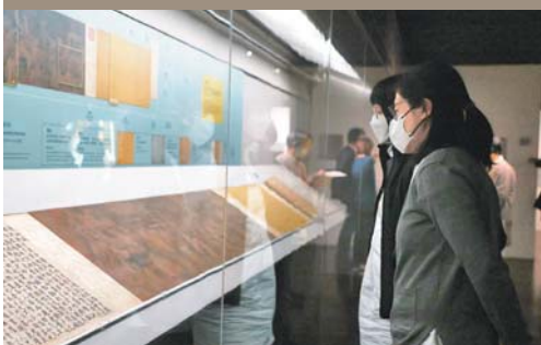
「文物檢測與修復在故宮」於故宮博物院北部院區正館登場，共規劃 3 大單元，展出 11 件文物。

「書畫修復」展示宋朝劉宋年的《十八學士圖》、清朝郎世寧的《畫交趾果然》2 件絹本畫，透過作品裝裱修復，引領觀眾認識不同裝裱形式與劣化狀況，並使用不同修復思維與方法，達到最好保護。