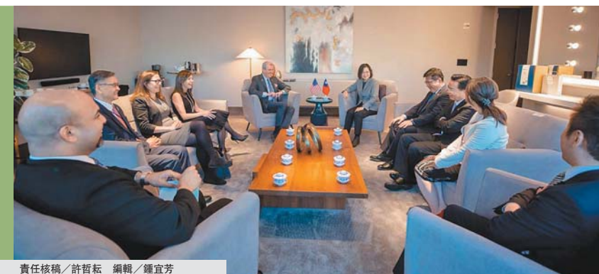
責任核稿／許哲耘 編輯／鍾宜芳