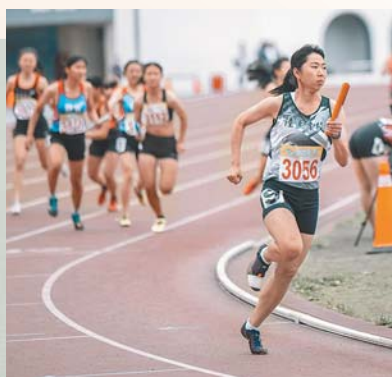
陸專學生於女子乙組4x400接力賽中發揮良好團隊默契，順利將銅牌入袋。