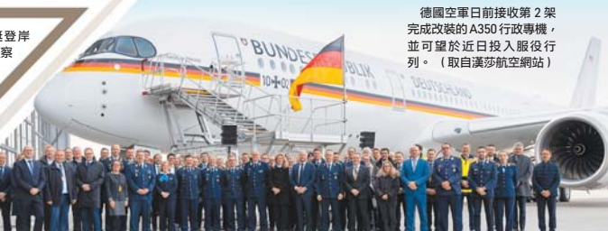
德國空軍日前接收第 2 架完成改裝的 A350 行政專機，並可望於近日投入服役行列。