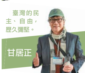
臺灣的民主、自由，歷久彌堅。