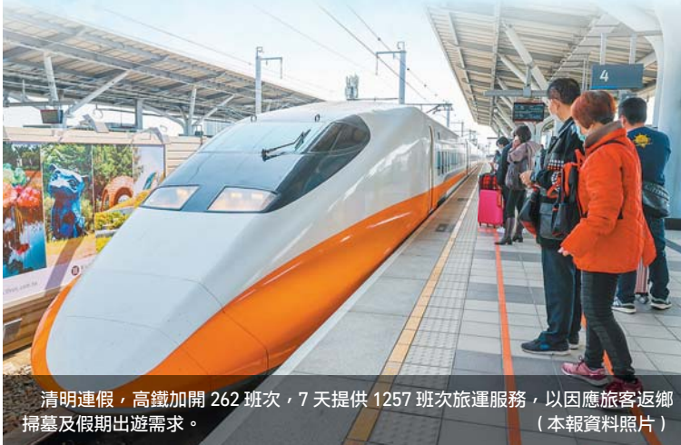
清明連假，高鐵加開 262 班次，7 天提供 1257 班次旅運服務，以因應旅客返鄉掃墓及假期出遊需求。