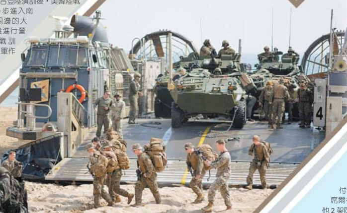
美軍氣墊登陸艇登岸後，LAV-25 兩棲偵察車隨即準備開上灘頭。