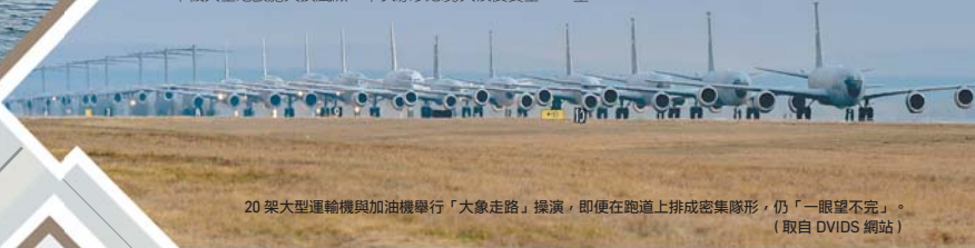
20 架大型運輸機與加油機舉行「大象走路」操演，即便在跑道上排成密集隊形，仍「一眼望不完」。

第 97 空運聯隊隊長克上校表示，這項演練的關鍵在於「快速、迅速與高效率同步作業能力」；而且由於演習規模遠比日常訓練更大，不僅有助提升空地勤人員專業技能，也能進一步強化美國空軍的全球投射能量。