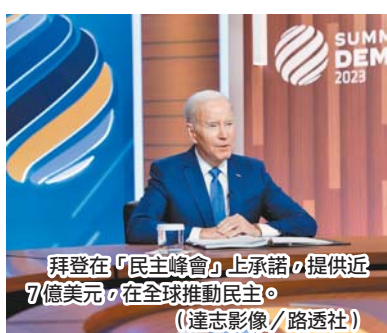
拜登在「民主峰會」上承諾提供近7億美元，在全球推動民主。

美國29日邀請包括我國在內121位領袖及代表，以視訊方式召開第2屆「民主峰會」，旨在團結民主國家捍衛全球民主。而拜登在演說中，盛讚這場峰會是「讓世界走向更自由、更有尊嚴及更民主的轉捩點」，並強調全球獨裁政權正在轉弱，民主國家正在變得更強大；他並在會