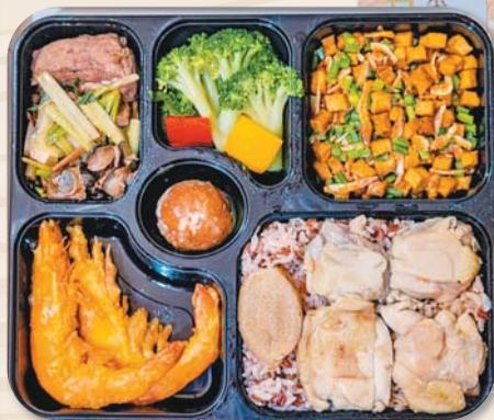
為了幫新北投車站慶生，臺北鐵路餐廳特別推出「酒家菜便當」。