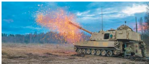
▲美國陸軍日前正式在波蘭「柯斯丘什科營」設立常駐基地。(取自 DVIDS 網站) ▲美軍駐波蘭基地規模持續擴大。圖為美陸軍日前在波蘭演訓，M109A6 自走砲進行實彈射擊。(取自 DVIDS 網站)