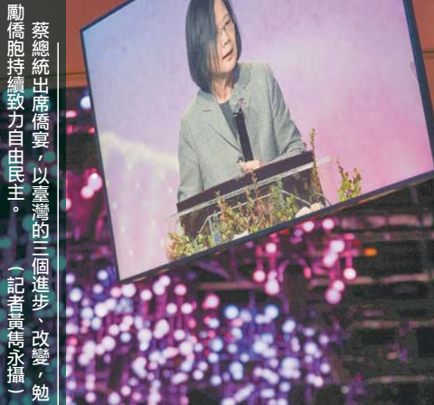
蔡總統出席僑宴，以臺灣的三個進步、改變，勉勵僑胞持續致力自由民主。