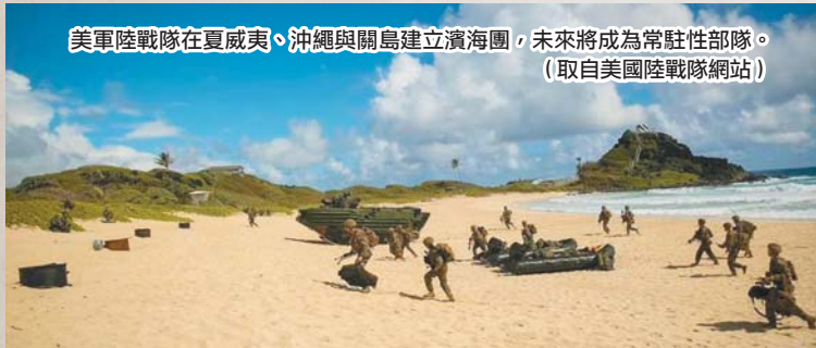
美軍陸戰隊在夏威夷、沖繩與關島建立濱海團，未來將成為常駐性部隊。