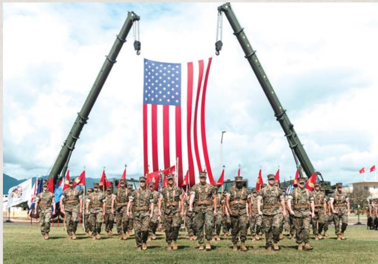
美國調整西太平洋島嶼軍事部署，將陸續建立陸戰隊濱海團（MLR），提高對中共的嚇阻能力及因應區域衝突的應變能力。

根據計畫內容，「陸戰隊濱海團」將減少戰機數量，捨棄大部分大砲、戰車等重型火力配置，改以較小型的