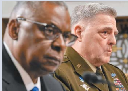
米利上將(右)29日與美防長奧斯汀共同出席眾院聽證會，示警美軍須為確保彈藥庫存做好準備。

《國防郵報》則指出，美國陸軍副部長卡馬里奧28日表示，美國正致力提高砲彈生產能量，包括挹注14.5億美元(約新臺幣441.92億元)，用於提高155公厘砲彈生產，以將產能在今年內，從每月1.4萬枚提升至每月2.4萬枚；並擬在2028財年前，進一步提升6倍，至每月生產超過8.5萬枚砲彈。