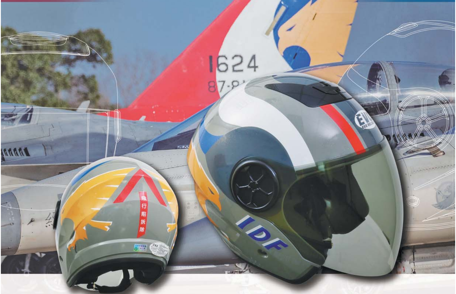
青文創 飛行騎士 F-CK-1 HELMET安全帽