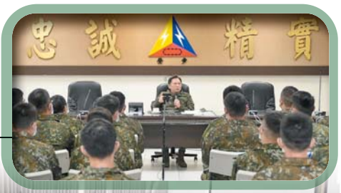
◆6軍團於裝甲584旅湖南營區辦理「清明連續假期軍紀安全巡迴宣教」。

盡職責本務，協助單位消弭潛藏危安因素外，也要加強新進人員輔導工作，為國軍培養優質人才；另鼓勵幹部，妥善利用連續假期，好好陪伴家人。