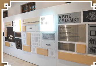
新富町文化市場常設展「一口新富」，介紹新富市場的發展沿革。