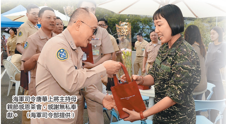
海軍司令唐華上將主持母親節感恩茶會，感謝無私奉獻。