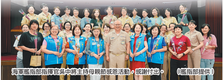
海軍艦指部指揮官吳中將主持母親節感恩活動，感謝付出。