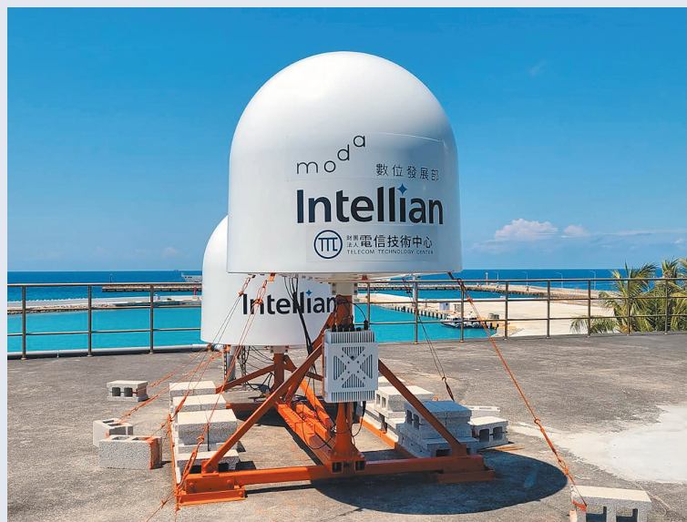
▲南沙太平島所開通的「中軌衛星 SES mPower」系統，就是「應變或戰時應用新興科技強化通訊網路數位韌性驗證計畫」的關鍵一環。

數位部所推動的這項計畫，目前委由財團法人電信技術中心（TTC）執行。依照契約，預計今年底前，完成 700 個非同步衛星終端設備站點、70 個基地臺衛星後傳鏈路站點、國外 3 個非同步軌道衛星終端設備站點，共計 773 個點位，建立我國專有之非同步軌道衛星應變網路。至於產業支持部分，中華電信理當成為領頭羊，率先與國際洽談高、中、低軌衛星合作，除了砸下新臺幣 70 億元，與新加坡電信擴大合作，共同投資發射衛星，也順利與英國戰略企業、擁有 6 百餘顆低軌衛星的 Eutelsat Oneweb 簽