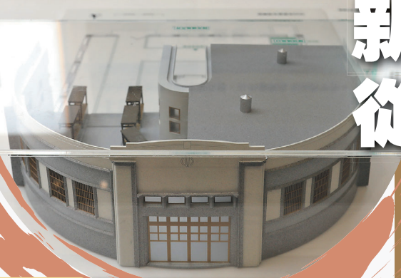
新富市場模型，為馬蹄形的建物。