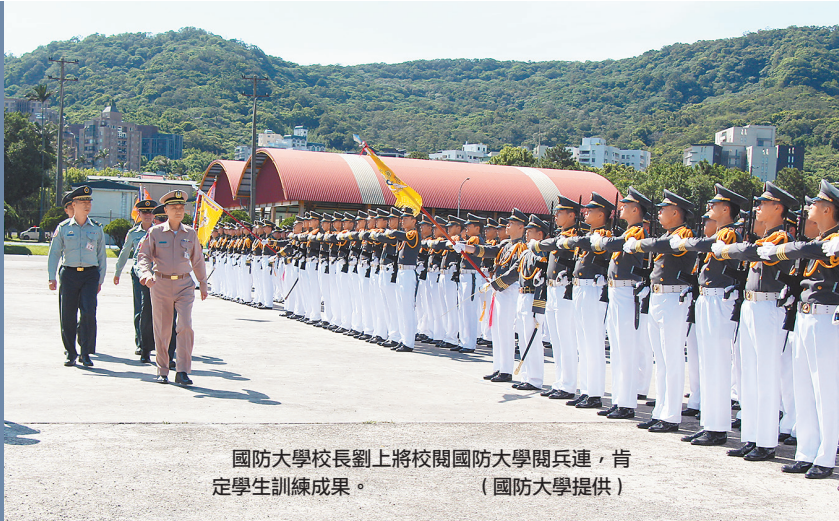
國防大學校長劉上將校閱國防大學閱兵連，肯定學生訓練成果。

劉校長強調，所有參演學生正是代表國軍新血輪的榮譽、希望與傳承，凸顯國軍「忠於國家，忠於人民，忠於團隊」的核心價值，展現「國家、責任、榮譽」信念，期勉每位學生持續加強自我體能、注意身體保健、飲食衛生，遵守紀律，展現軍校風範，為國防大學爭取榮譽。