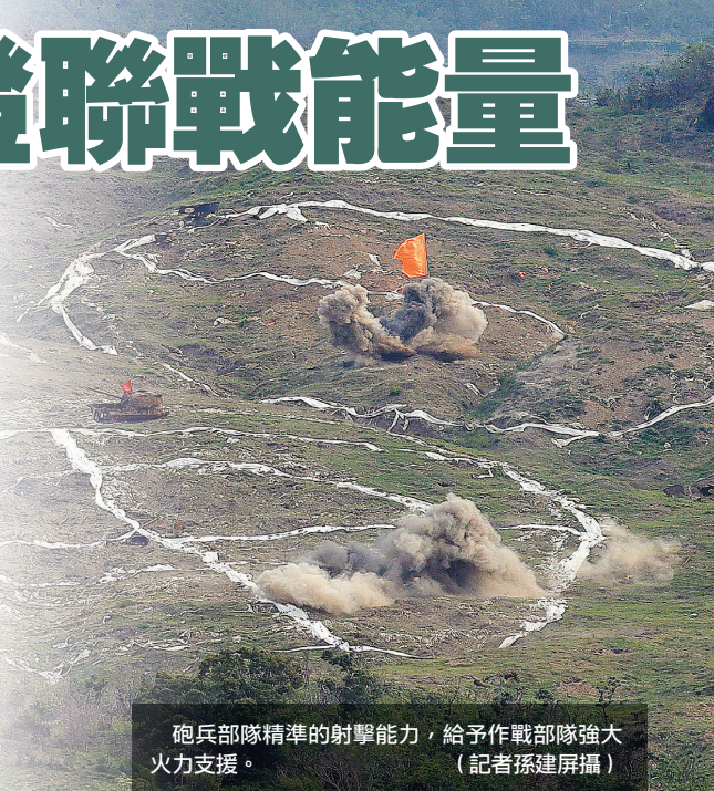
砲兵部隊精準的射擊能力，給予作戰部隊強大火力支援。

此外，在攻擊作戰的最後階段，地面部隊展開集火射擊後，陸戰66旅步3營官兵立即下車戰鬥，快速衝鋒攻向敵陣地奪取目標，官兵高昂的士氣、堅持到底的毅力和精神，在在展現「先鋒部隊」的英名。