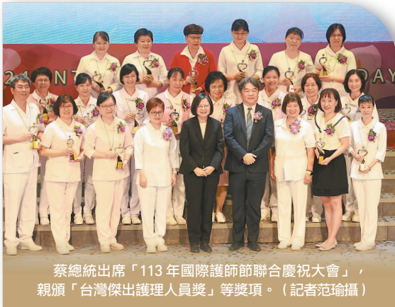
蔡總統出席「113年國際護師節聯合慶祝大會」，親頒「台灣傑出護理人員獎」等獎項。

芊獲此殊榮。她自民國 54 年進入國防醫學院護理學系就讀，迄今持續精進護理專業，秉持護理悲天憫人之心，以實事求是的精神，憑藉專業訓練與實務經驗，關注維護國人民生命權、健康權、弱勢族群就醫與就業等議題，且長年參與國內、外護理專業組織，以提升我國護理專業水準，並爭取醫療衛生人員之權益與關懷民生福祉不遺餘力，實為護理人員之典範。