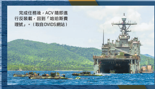
完成任務後，ACV 隨即進行反裝載，回到「哈珀斯費理號」。