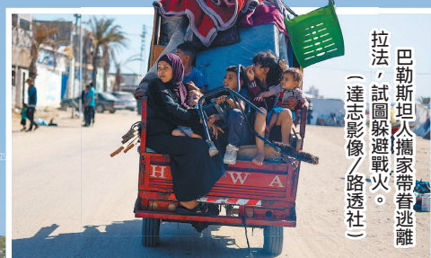
巴勒斯坦人攜家帶眷逃離拉法，試圖躲避戰火。(達志影像/路透社)

此前已有五角大廈官員證實，由於以色列一再宣示將全面進攻拉法，卻未透過制定有效疏散與救援計畫，確保在該地避難的上百萬名巴勒斯坦平民安全，美方已因此暫停軍援部分「重型彈藥」(high-payload munitions)。