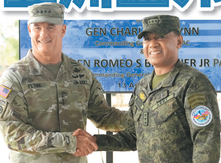
◆ 弗林上將表示，太平洋陸軍分散在廣闊區域內，須與盟邦合作，共維區域安全。圖為弗林（左）去年4月視察美菲「肩並肩」聯演。