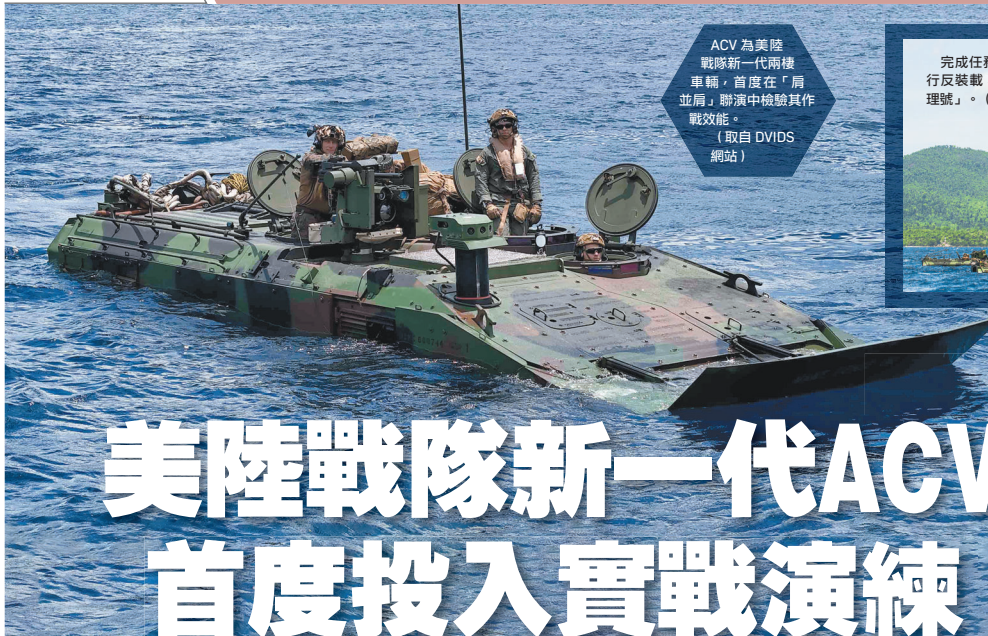
ACV 為美陸戰隊新一代兩棲車輛，首度在「肩並肩」聯演中檢驗其作戰效能。