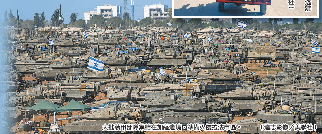
大批裝甲部隊集結在加薩邊境，準備入侵拉法市區。

英國祭出一系列限制外交人員的措施，對抗俄國惡意行為。圖為俄國駐英大使館。