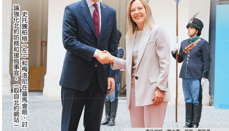
史托騰柏格(左)和梅洛尼在羅馬會晤，討論強化北約防務和援烏事宜。

史托騰柏格也感謝義大利支持北約在科索沃的維和任務，以及在伊拉克訓練任務，並期待義大利協助北約制定南歐與北非防務方針。