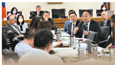
國防部副部長徐衍璞上將列席外交及國防、司法及法制委員會聯席會議。

會前徐副部長接受媒體聯訪時表示，美艦本月 8 日通過臺灣海峽，國軍全程掌握其通過海峽動態，狀況正常；國防部對於有利於區域和平穩定的各項行動，都給予支持。另關於「520」前後，中共可能擾臺，徐副部長指出，國防部對於臺海周邊各項情勢，都能運用各項情監偵手段即時掌握，也會適時公布，如有特殊狀況，會採取相關預警，目前臺海周邊情勢穩定且正常。