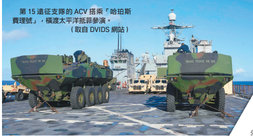
第15遠征支隊的ACV搭乘「哈珀斯費理號」，橫渡太平洋抵菲參演。