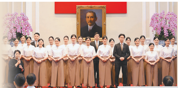
責任核稿／許哲耘 編輯／周翔