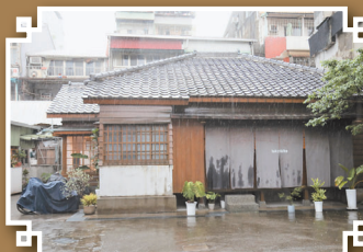
主建物旁有棟日式木造傳統建築，從前作為管理員的辦公及宿舍空間。

新富市場長期的發展停頓，反而保留下日據時期的建物原貌，於民國95年被指定為臺北市市定古蹟，106年此處以「新富町文化市場」之姿重新開市，卸下傳統市場功能，搖身一變成爲複合型的創意基地，從飲食教育、社區營造、市場生活觀察等議題出發，舉辦一系列展覽、講座、工作坊等活動，為老市場注入新一代的設計能量與活力，展現新富町文史與庶民風景。