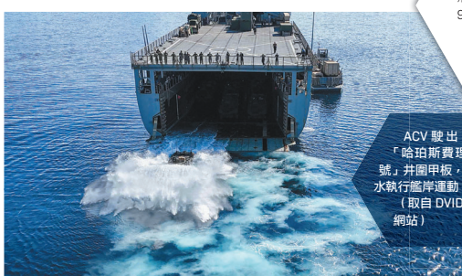
ACV駛出「哈珀斯費理號」開闢甲板，泛水執行艦岸運動。

雖然兩棲突擊艦「拳師號」(LHD 4)故障，使得本次參與「肩並肩」聯演的ACV數量大減，但陸戰隊第15遠征支隊指揮官迪南上校表示，這次演習展現ACV的設計概念，完全符合陸戰隊預期的未來戰場環境，後續也將持續累積ACV操作經驗回饋給友軍與製造商，以利未來執行各項作戰任務。