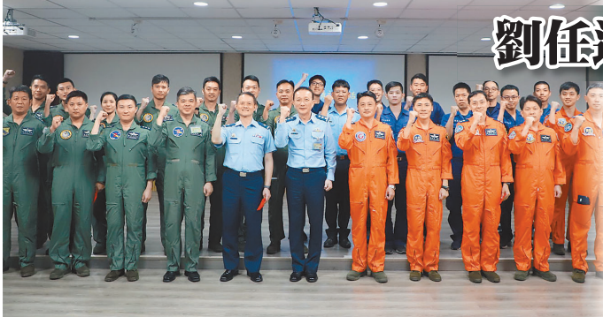
劉任遠慰勉總統就職典禮空中分列式參演官兵，期展壯盛軍容。

管控及人員訓練等層面都要各司其職，戮力以赴，讓機隊在典禮當天能分秒不差完成任務。本次空軍在「總統就職典禮暨慶祝大會」派遣由F-16、IDF、幻象2000、勇鷹高教機組成的梯隊實施空中分列式，並以雷虎小組壓軸衝場；劉司令勸勉操演部隊，愈接近成功，愈不能鬆懈，要堅持到最後一刻，用精湛技術與愛國信念，展現空軍捍衛領空的堅實戰力，在歡慶總統就職的光榮時刻，為軍旅生涯留下珍貴回憶。