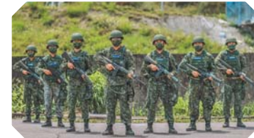
←新竹後備旅步1營步2連第3排第2班，雖然成員來自各行各業，卻沒因此產生溝通隔閡，反而更加投入新制教召訓練，深具愛國心。

享部隊經驗，「手把手」帶領他們完成各項任務，令他感到相當溫暖；他強調，除了幹部領導，他們也運用課餘時間分享各自訓練的心得，氣氛十分融洽；除提升戰技外，也凝聚團隊士氣，進一步強化整體精神戰力。