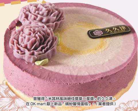
曾獲得「米其林風味絕佳獎章三星獎」的久久津，在OK mart獻上新品「繽紛馨情蛋糕」。