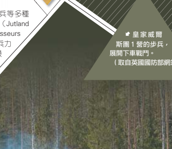
◆皇家威爾斯團 1 營的步兵，展開下車戰鬥。