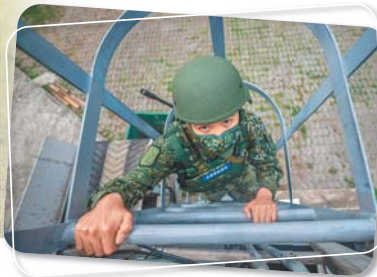
←召員積極施展各項戰術作為，充分展現後備部隊戰力精實的一面。 (記者陳怡瑋攝)