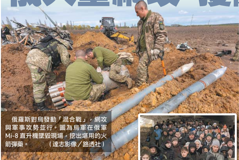
俄羅斯對烏發動「混合戰」，網攻與軍事攻勢並行。圖為烏軍在俄軍 Mi-8 直升機墜毀現場，挖出堪用的火箭彈藥。

微軟表示，烏俄衝突開始前後，俄國政府相關駭客，以及數個與俄國結盟的國家行為者，對烏克蘭發動 237 次具協調性的網攻，除「擾亂或降級烏克蘭政府與軍事功能，破壞民眾對相關組織信任」，微軟還追蹤到將近 40 次破壞性網攻，鎖定烏克蘭中央至