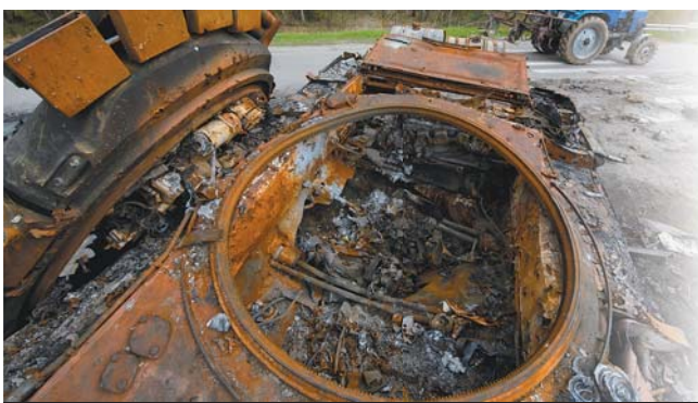
烏俄衝突期間，經常可見俄軍戰車砲塔被炸飛的殘骸，這與其先天設計不良有關。圖為俄軍 T-72B3 殘骸。

根據英國國防部 25 日評估，俄軍已損失 580 輛戰車，但損失更大的，恐怕是需要長時間訓練的專業戰甲車組員，這將會讓俄軍戰力愈打愈弱。