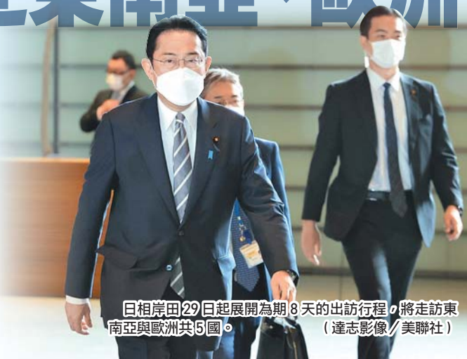
日相岸田 29 日起展開為期 8 天的出訪行程，將走訪東南亞與歐洲共 5 國。

至於岸田 5 月 1 日訪問泰國期間，預期將與泰國簽訂「防衛裝備品暨技術轉移協定」，加深國防領域合作，同時爭取讓日本防衛裝備出口泰國；據傳泰方目前青睞日製巡邏機與救難用的飛機。