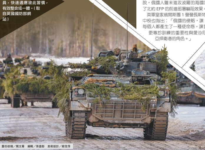
責任核稿／簡文書 編輯／張晏影 美術設計／歐佳萍