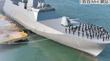
造艦過程延宕的「最上號」終於於成軍服役，自出生地長崎啟航，前往未來母港橫濱。(取自 MHI 網站)