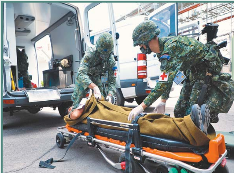
國軍軍陣醫學涵蓋層面廣泛，除因應戰場需求的戰傷救護，針對人員心理狀態的心衛與精神照護，提供官兵全方位醫療資源，有效維護國軍整體戰力。

以 JAMA Psychiatry 研究新冠病毒疫情顯示，在醫院接受治療的疫情倖存者，出現創傷後壓力症候群比例爲 30.2%，略低於 MERS 與 SARS 的 32.2%，與卡翠納颶風 30% 相當，略高於日本 311 大地震與海嘯 25%，以及 911 恐攻事件附近居民 20%，嚴重影響個人、家庭、職業與社會功能；