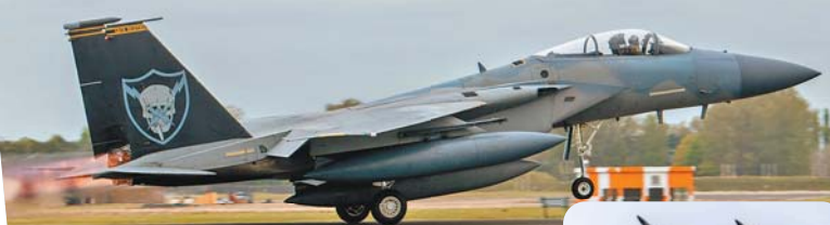
◆美空軍第 493 中隊的 F-15C「告別歐洲塗裝」繪機開啟後燃器，最後一次自拉肯希斯基地升空。除尾翼彩繪外，該架戰機已清除絕大部分塗裝。

值得一提的是，即便第 493 中隊自去年開始換裝 F-35A，所轄的 F-15C/D 戰機亦陸續返美，該中隊依舊保持優良戰備狀態，在 2 月烏俄衝突爆發時，隨即派出 8 架已清除塗裝、準備返美的妥善機，成為首批前進部署波蘭的美軍機隊，捍衛北約天空。