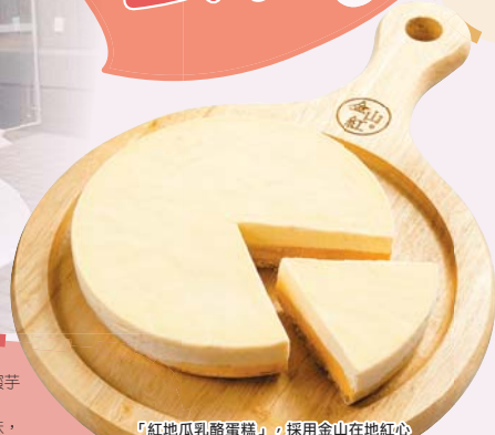
「紅地瓜乳酪蛋糕」，採用金山在地紅心地瓜泥搭配頂級澳洲乳酪製成。(業者提供)