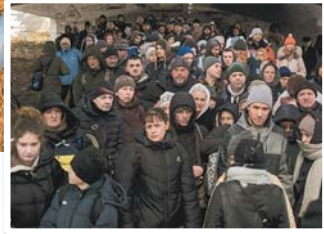
→ 俄國已發動數百次網攻，有系統地蒐集烏克蘭民眾個資。圖為 3 月撤離基輔的烏克蘭民眾。