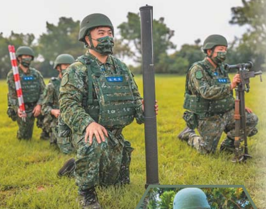
→為驗證連日來新制教召訓練成效，新竹後備旅步1營昨日實施逆襲戰鬥、射擊陣地轉移等課程。

程也進入最後驗收階段。昨日課程中，召員模擬預備隊逆襲戰鬥，除依「阻止尖端、固守肩部、封鎖底部、打擊腰部」原則進行演練，也在幹部狀況誘導及反覆操作下完成演練，驗證整體施訓成效。此外，兵器連81迫擊砲排實施射擊陣地轉移訓練過程中，召員不僅流暢執行陣地佔領、陣地開設及架砲作業，也於規定時間內完成射擊準備；召員於日前先後經歷迫擊砲聯合操作、訓練模擬彈射擊等訓練後，已培養良好默契；昨日展現訓練精練成果同時，捍衛家園的付出與決心也表露無遺。