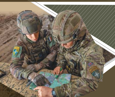
◆「大膽之龍」的關鍵，就是讓英法與丹麥的指參人員，快速適應彼此習慣，有效整合成一體。