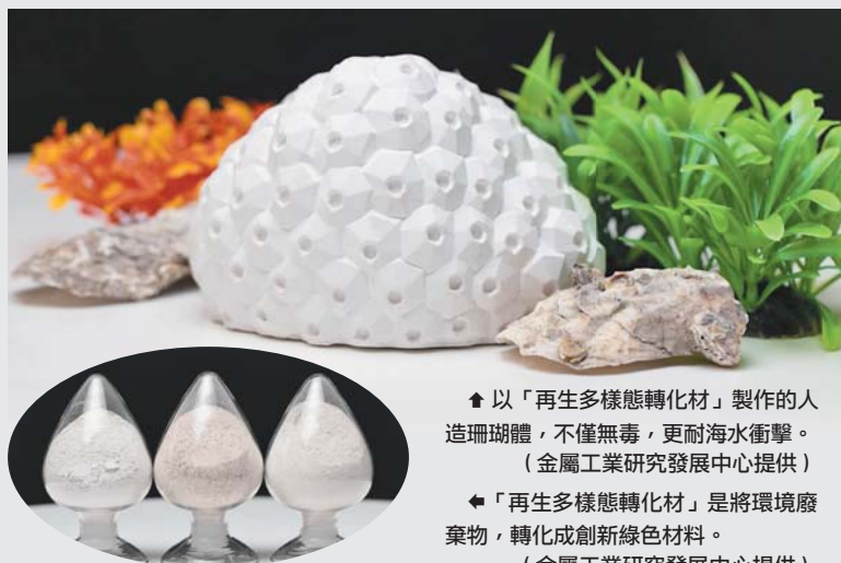
▲以「再生多樣態轉化材」製作的人造珊瑚體，不僅無毒，更耐海水衝擊。 (金屬工業研究發展中心提供) ▲「再生多樣態轉化材」是將環境廢棄物，轉化成創新綠色材料。 (金屬工業研究發展中心提供)