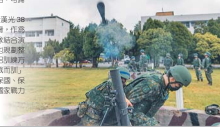
新制教召透過扎實訓練循序漸進，提升召員個人戰技及整體防衛戰力。

事實上，國防部日前舉辦記者會說明「漢光38號」演習規劃，也肆應共軍現階段犯臺威脅，作為想定設計的基礎及演練課目，且將後備部隊結合演習重點，納入同心演習驗證；此外，演習也規劃整合全民總力支援軍事作戰，以雷的新制教召訓練方式，務實驗證各項戰術作為，以符合「為戰而訓」的防衛作戰目標，並達到「保家、保鄉、保國、保產」國土防衛能力，同時凸顯後備軍人為國家戰力不可或缺之關鍵。