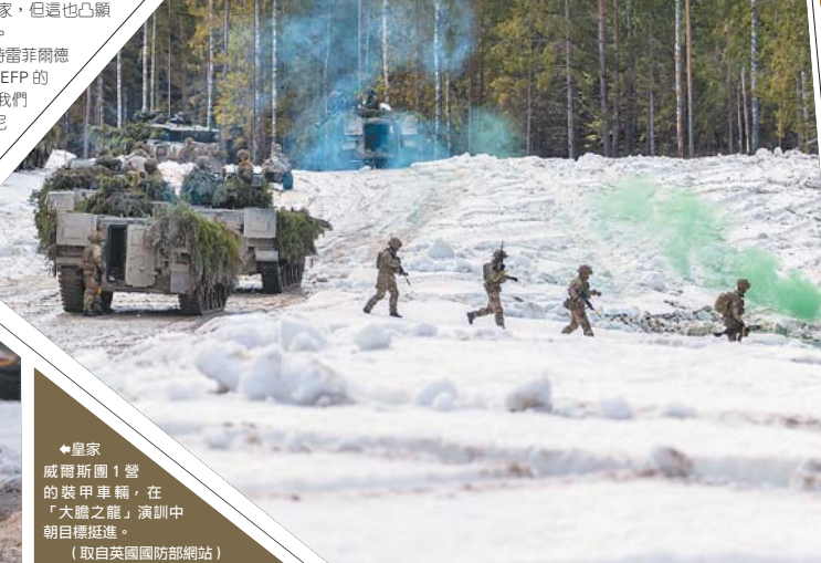
◆皇家威爾斯團 1 營的裝甲車輛，在「大膽之龍」演習中朝目標挺進。