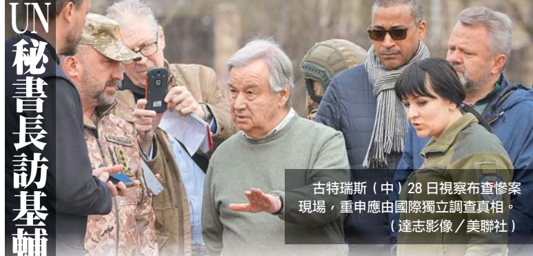
古特瑞斯(中) 28 日視察布查慘案現場，重申應由國際獨立調查真相。