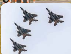
◆最後一批 4 架 F-15C，編隊飛越拉肯希斯基地，向其正式告別。