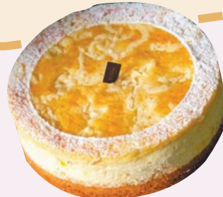
OK mart 推出多款異國風手作甜品。

品，以及多款得獎蛋糕、點心；其中，2020年獲得「米其林風味絕佳獎章三星獎」的久久津，此次在OK mart獻上新品「繽紛馨情蛋糕」與「北海道布蕾蛋糕」，另有日式伴手禮聞名的手信坊「芋雪捲」、甜點專家恬品軒的「日式抹茶捲」，讓喜愛日系風格的媽媽一飽口福。