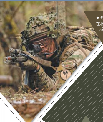
◆丹麥「維京」連官兵，在林間以臥姿持槍警戒。

英軍皇家威爾斯團 1 營營長斯特雷菲爾德中校也指出：「俄國的侵略，讓 EFP 的每個人都產生了一種使命感，讓我們更專於訓練的重要性與愛沙尼亞捍衛者的角色。」