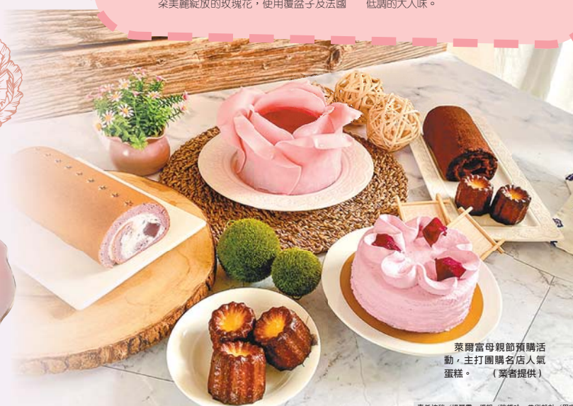
萊爾富母親節預購活動，主打團購名店人氣蛋糕。(業者提供)