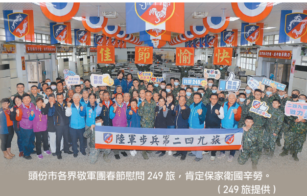
頭份市各界敬軍團春節慰問 249 旅，肯定保家衛國辛勞。

邱副旅長表示，春節前夕，特別感謝敬軍團體慰問，深深感受到頭份各界對官兵的關懷與支持，期盼持續深化地方交流互動，建立「軍愛民、民敬軍」的良善關係；此外，國軍官兵將持恆精實訓練成效，堅定守護家園、捍衛國家安全，以不負國人殷切期待。