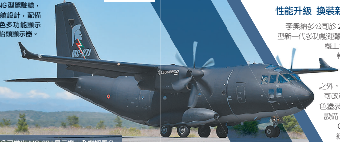
李奧納多公司推出 MC-27J 展示機，全機採黑色塗裝，是目前擔任特種任務飛機的熱門機種。