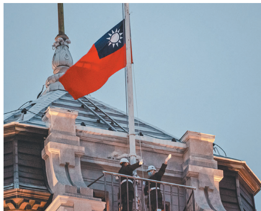
素有「天下第一營」美譽的憲兵第 211 營，其升旗班負責總統府每日升、降旗的工作。（本報資料照片）

國家中樞的安全，不論是每日升（降）旗、站標兵哨或執行巡邏哨等任務，在工作崗位上兢兢業業、奉獻心力，把每一個細節做到盡善盡美，雖然看似簡單、習以為常的小事，卻是官兵們引以為傲的大事；全體官兵應體認每個人都是單位重要的螺絲釘，上至高階幹部，