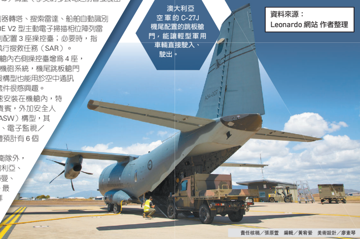
責任編輯／張原堂 編輯／黃宥榮 美術設計／廖素琴