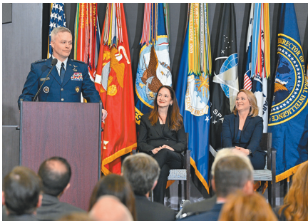
▲霍夫(左)正式接掌網路司令部及國安局，同時晉升上將，國家情報總監海恩斯(中)與美副防長希克斯也親自出席典禮。

希克斯表示，在21世紀充滿挑戰的安全環境中，米德堡處於前線，且隨著威脅與挑戰持續變化，