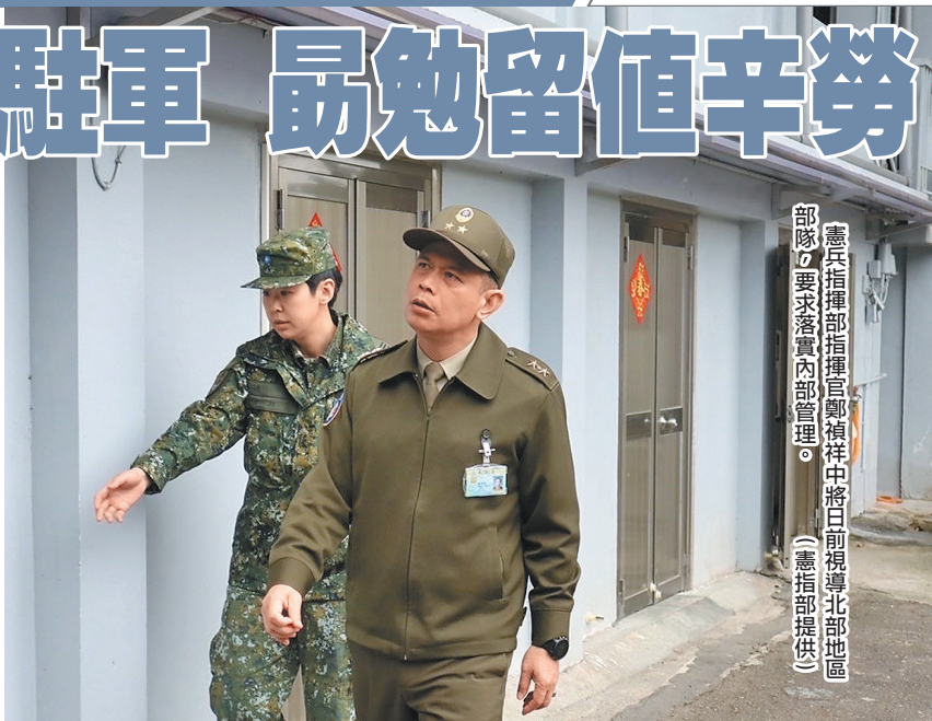
憲兵指揮部指揮官鄭禎祥中將日前視導北部地區部隊，要求落實內部管理。

鄭指揮官也勗勉官兵留值辛勞，提醒春節期間，幹部須加強軍法紀宣教，落實內部管理，並綿密反向查詢及家屬聯繫，以有效掌握官兵動態，確維部隊戰力與安全。