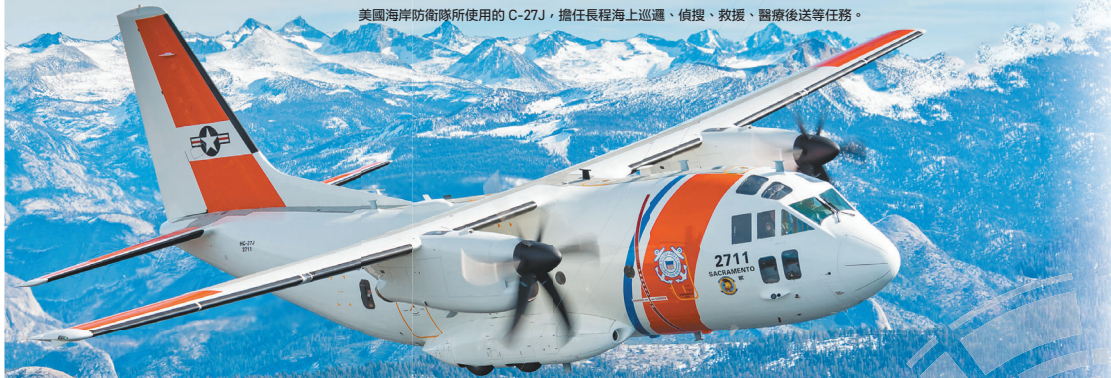
美國海岸防衛隊所使用的 C-27J，擔任長程海上巡邏、偵搜、救援、醫療後送等任務。