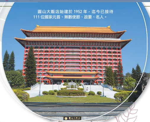
圓山飯店始建於1952年，迄今已接待111位國家元首、無數使節、政要、名人。