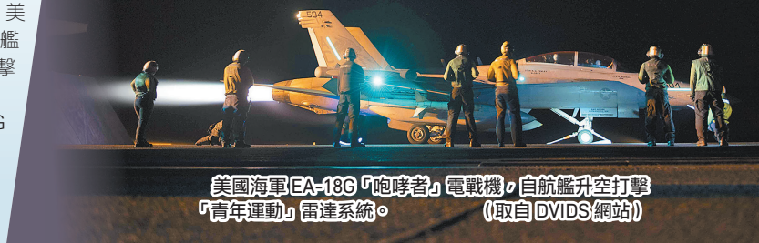
美國海軍EA-18G「咆哮者」電戰機，自航艦升空打擊「青年運動」雷達系統。

雖然以美國為首的多國部隊已對「青年運動」實施多次打擊，但該組織發言人薩里仍揚言，不會停止攻擊行動，並宣稱攻擊不會阻擋他們對加薩巴勒斯坦人的支持。對此，美國五角大廈強調，美國與盟國將持續努力，執行「繁榮衛士」護航行動，維護航行和貿易自由，並警告「青年運動」停止威脅行徑。