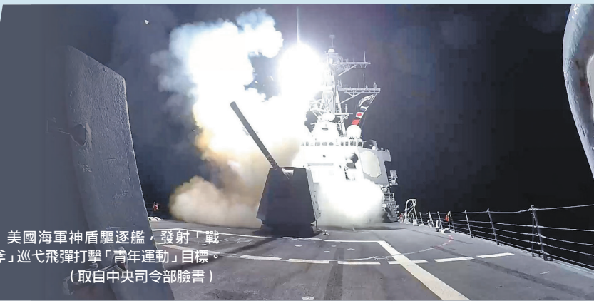
美國海軍神盾驅逐艦，發射「戰斧」巡弋飛彈打擊「青年運動」目標。