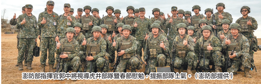
澎防部指揮官郭中將視導虎井部隊暨春節慰勉，提振部隊士氣。

郭指揮官於慰勉時表示，身為職業軍人，保家衛國乃是最高使命，同仁應各司其職，持續專注戰訓本務，以奠基國軍整體可恃戰力。最後，郭指揮官祝福全體官兵新年快樂，闔家平安。