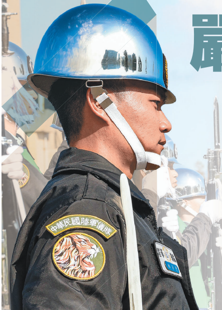
國防部 113 年三軍儀隊進階專業評鑑，精進禮儀勤務、展現「國家門面」形象。

期間，首先進行 60 分鐘的耐力評鑑，鑑測人員需身穿防寒夾克，全程站立不動考驗持槍穩定性及耐力，由於近期天氣明顯回暖，白天高溫達 29 度，官兵滿頭大汗，仍須聞風不動至鑑測結束。接續登場，個別出列實施槍法操作，由鑑測官一對一考核「空拋」、「左旋」、「前平」、「驗槍」、「水二」、「慢單」及「轉槍 30 轉」等指定動作，只見儀隊官兵力求完美，紛紛展現高超操槍技法，並順利通過考驗，彰顯三軍儀隊榮譽信念。