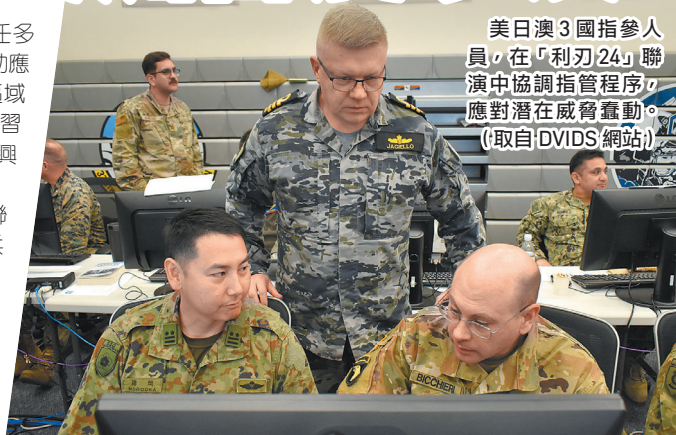
美日澳3國指參人員，在「利刃24」聯演中協調指揮程序，應對潛在威脅蠢動。

「利刃」指揮所演習為美日兩年一次的聯演，其會與「利劍」(Keen Sword)實兵聯演交替進行，完善多方聯戰戰力、指揮程序，乃至於作業互通性等；此次在「利刃24」首度納入澳軍部隊，展現日澳在簽署《相互准入協定》(RAA)後，雙方日益深化的夥伴關係，並與美軍聯手一起維護區域和平穩定，嚇阻潛在威脅蠢動意圖。