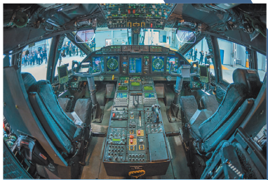
▲C-27J NG 型駕駛艙，採用玻璃座艙設計，配備 5 具大型彩色多功能顯示器，並加裝抬頭顯示器。