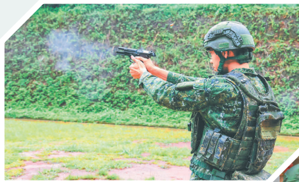
↑ 戰備偵巡結合實戰化射擊訓練，官兵實施 T75K3 手槍實彈射擊。

隨後，戰備部隊結合實戰化射擊訓練，實施 T75K3 手槍實彈射擊、T91 步槍快速反應射擊，官兵熟稔操作編制武器，運用障礙板變換臥、跪、立等射擊姿勢，快速朝目標射擊，展現平時訓練成果，有效強化戰時應處效能。