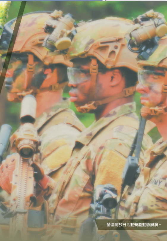
營區開放日活動規劃動態展演。

美國陸軍「突擊兵」(Ranger)有著悠久的歷史與赫赫戰功，其中，那一句「突擊兵做先鋒」(Rangers Lead the Way)的格言，更為眾人津津樂道；而這一句流傳下來的格言，正來自二戰末，對「第5突擊兵營」的指令！