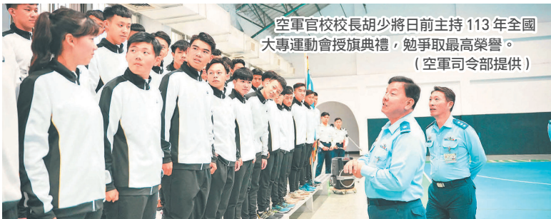
空軍官校校長胡少將日前主持 113 年全國大專運動會授旗典禮，勉爭取最高榮譽。