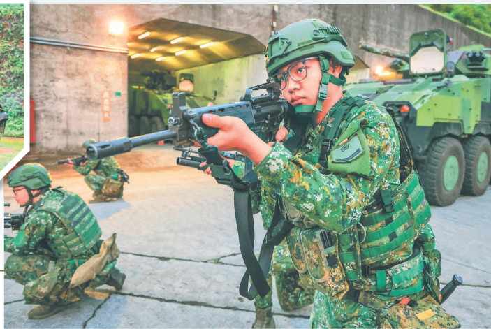
→ 官兵抵達後，迅速下車戰鬥，合力達成重要目標防護。