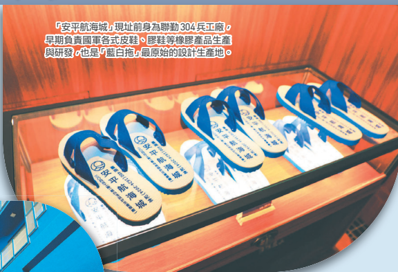
「安平航海城」現址前身為聯勤304兵工廠，早期負責國軍各式皮鞋、膠鞋等橡膠產品生產與研發，也是「藍白拖」最原始的設計生產地。