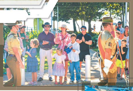
「紐澳軍團日」可說是澳洲軍人節，民眾攜家帶眷同赴街頭，向守衛家園的官兵致敬。