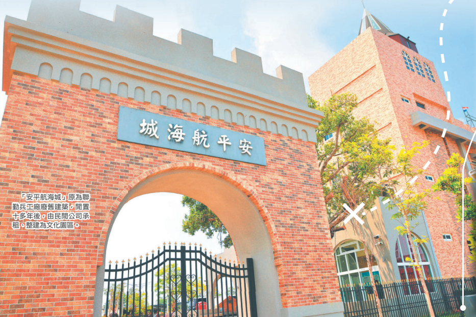
「安平航海城」原為聯勤兵工廠廢舊建築，閒置十多年後，由民間公司承租、整建為文化園區。