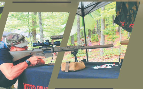
在範圍不大的營區內，仍規劃豐富的靜、動態活動。