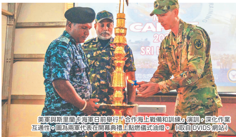
美軍與斯里蘭卡海軍日前舉行「合作海上戰備和訓練」演訓，深化作業互通性。圖為兩軍代表在開幕典禮上點燃儀式油燈。

第7艦隊表示，今年是第29年舉辦CARAT系列演訓，而美軍也將持續與印太友邦舉行各項演訓，藉由累積承平時期的行動經驗與合作默契，進而在遭遇各種突發狀況與危機之際，可以透過聯合行動應對潛在威脅，為確保區域穩定做出具體貢獻。