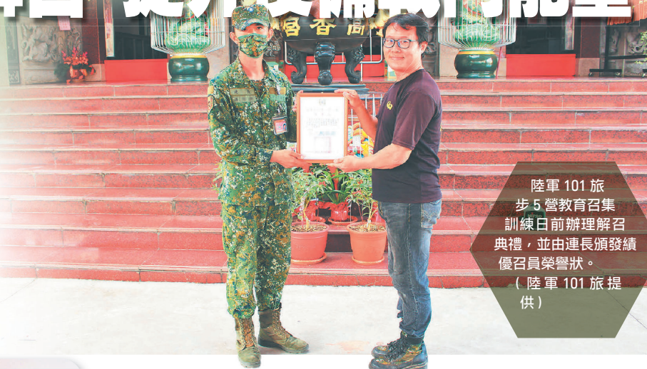
陸軍 101 旅步 5 營教育召集訓練日前辦理解召典禮，並由連長頒發績優召員榮譽狀。

步 5 營營長包中校指出，「勿恃敵之不來，恃吾有以待之」，期藉由教育召集訓練，使召員了解當前國防政策，並熟稔軍事專業專長與射擊能力，進而提升後備部隊戰鬥能力，厚植防衛戰力。