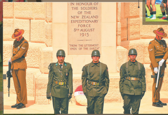
澳軍官兵(左1、右1)與土耳其官兵在土耳其加利波里灣(現已改名為紐澳軍團灣)紀念碑前，舉行紀念儀式。