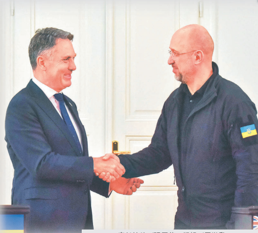
責任核稿／張原萱 編輯／周胤勳