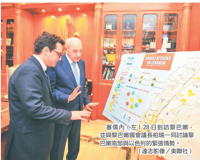
塞內內(左) 28 日到訪黎巴嫩，並與黎巴嫩國會議長柏瑞一同討論黎巴嫩南部與以色列的緊張情勢。