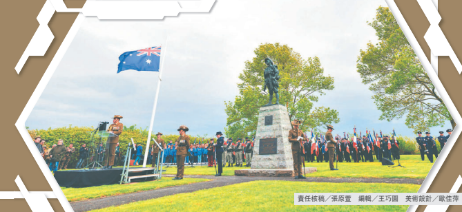
責任編輯/張原豐 編輯/王巧圓 美術設計/歐佳萍