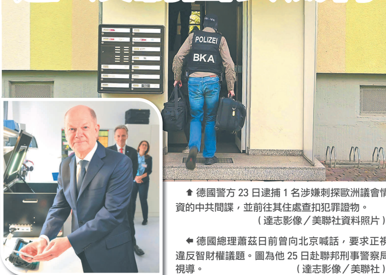
▲ 德國警方 23 日逮捕 1 名涉嫌刺探歐洲議會情資的中共間諜，並前往其住處查扣犯罪證物。

德國總理蕭茲曾於上週訪問中國大陸時，公開喊話北京當局正視侵犯智慧財產權的議題，而德國警方隨後便宣布破獲三起間諜案件，凸顯德國情報機構「聯邦憲法保護局」(BfV)的反情報工作效能大幅提升，未來可望持續查緝俄「中」的滲透行徑，防堵經濟與科技外洩，有效確保德國國家安全。