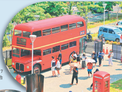
→ 園區整體設計為17世紀大航海時代，並融合多國文化意象與內涵。