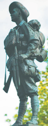
澳洲在法國比勒庫爾舉行紀念儀式，紀念一戰期間與英法盟軍並肩作戰的歷史。