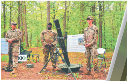
除了槍械外，迫擊砲也是突擊兵必須會操作的武器。

值得一提的是，突擊兵與我國的歷史頗有淵源，在第二次世界大戰時期，突擊兵的前身部隊就在中美印地區與日本周旋，迄今突擊兵團的臂章還能見到我國的青天白日徽，而我國的突擊兵訓練後來也深受其影響。能夠在國外感受到外國軍事單位，對這段二戰盟邦情誼歷史的珍視，或許才是最應該感到自豪的一部分。