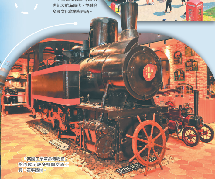
「英國工業革命博物館」館內展示許多相關交通工具、軍事器材。