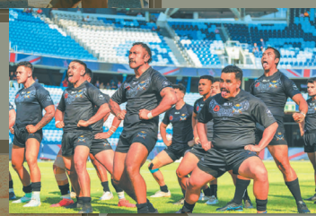
紐西蘭國家橄欖球隊在雪梨舉行比賽前，表演「哈卡」(Haka)戰舞，展現滿滿活力與強健體魄。