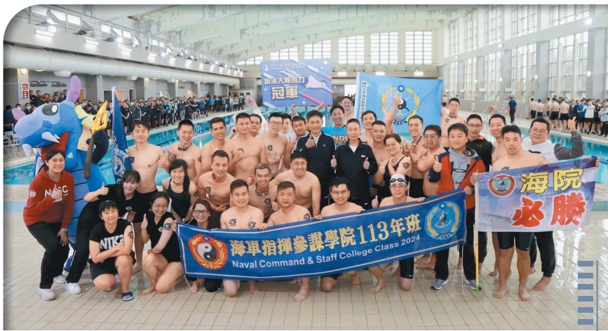
國防大學校長劉志斌上將主持校慶體育競賽，期勉學員生展現運動家精神。