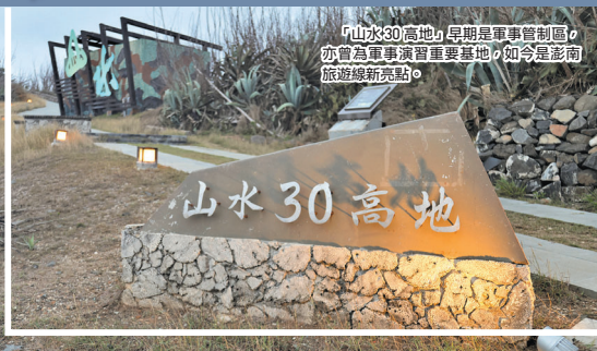
「山水30高地」早期是軍事管制區，亦曾為軍事演習重要基地，如今是澎湖旅遊線新亮點。