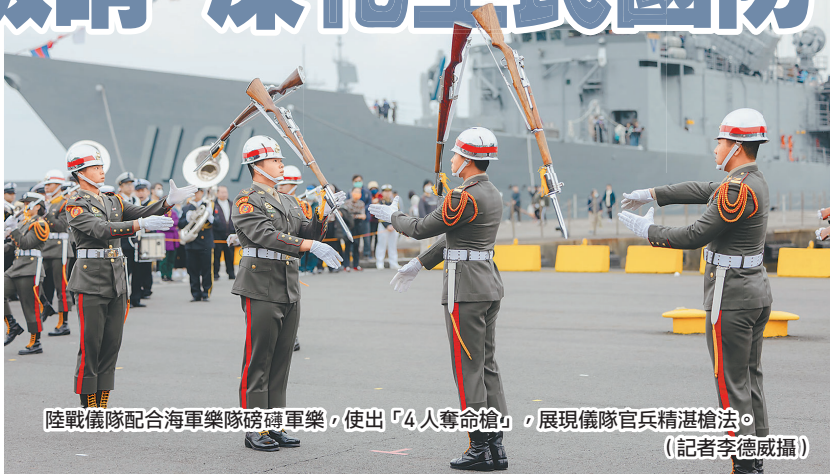
陸戰儀隊配合海軍樂隊磅礴軍樂，使出「4人奪命槍」，展現儀隊官兵精湛槍法。

等3艘支隊任務艦昨日清晨抵達蘇澳港，展開2天1夜行程。其中，除安排磐石等3艘軍艦開放參觀，也由海軍官校鼓號樂隊、陸戰儀隊及莒拳隊帶來精彩的表演，氣氛熱絡。過程中，陸戰儀隊配合海軍樂隊磅礴軍樂，接連使出「一字波浪」、「X字隊形變化」及「4人奪命槍」，展現儀隊官兵整齊劃一的槍法與步伐，讓觀賞民眾驚嘆不已。此外，現場設置招募攤位，並透過安排穿戴裝備體驗與官兵說明，使民眾了解海軍單位特性與官兵辛苦的訓練過程，不僅拉近軍民距離，更有效深化全民國防。