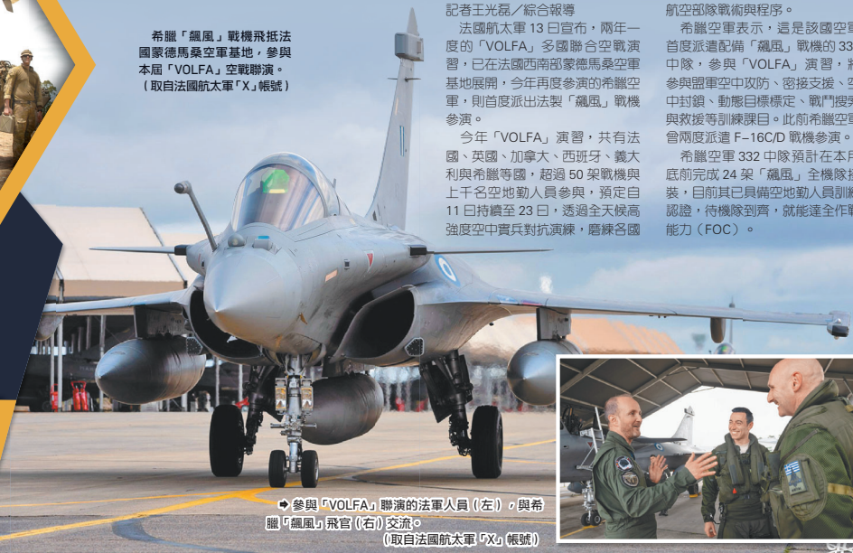
參與「VOLFA」聯演的法軍人員（左），與希臘「颶風」飛官（右）交流。 (取自法國航太軍「X」帳號)

希臘「颶風」戰機飛往法國蒙馬索空軍基地，參與本屆「VOLFA」空戰聯演。 (取自法國航太軍「X」帳號)