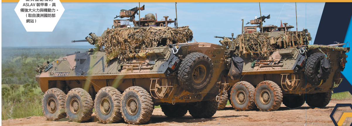
責任撰稿／簡文菁 編輯／黃有崇 美術設計／歐佳萍

澳軍第 2 騎兵團配備的 ASLAV 裝甲車，具備強大火力與機動力。