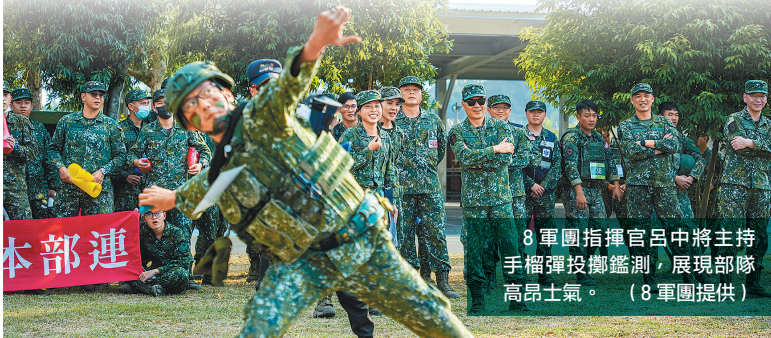
8軍團指揮官呂中將主持手榴彈投擲鑑測，展現部隊高昂士氣。

從難、求精求實」態度，放鬆心情拿出平時訓練成果，再創佳績。此外，不論參加選手或加油團隊，均竭盡最大努力，為單位爭榮譽，展現部隊高昂士氣，有效凝聚向心力。