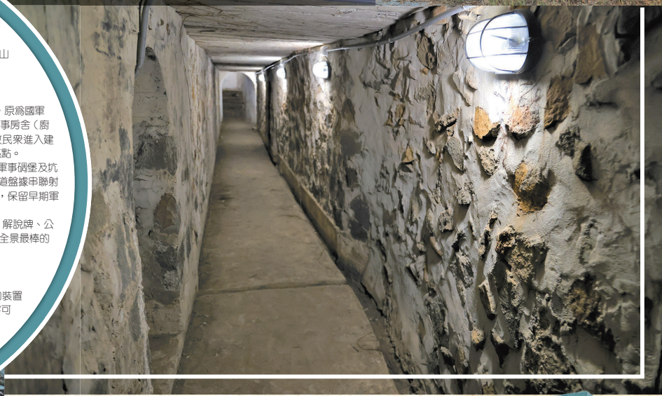
坑道內部及外觀整體狀況大致良好，保留早期軍事原始風貌。

值得一提的是，園內設置鋼結構燈光造景裝置，以「山水」圖像的裝置藝術，命名為「山水映輝」，在白天營造360度視角皆可觀看，遊客可於結構體下方自由穿梭，從山水沙灘遠觀山型意象；在夜間則搭配景觀照燈的設置，點亮公園，豐富多彩燈光變化，塑造出「山」與「水」互動感受，打造澎湖夜間新地標，展現不同於白天的夜間氛圍。