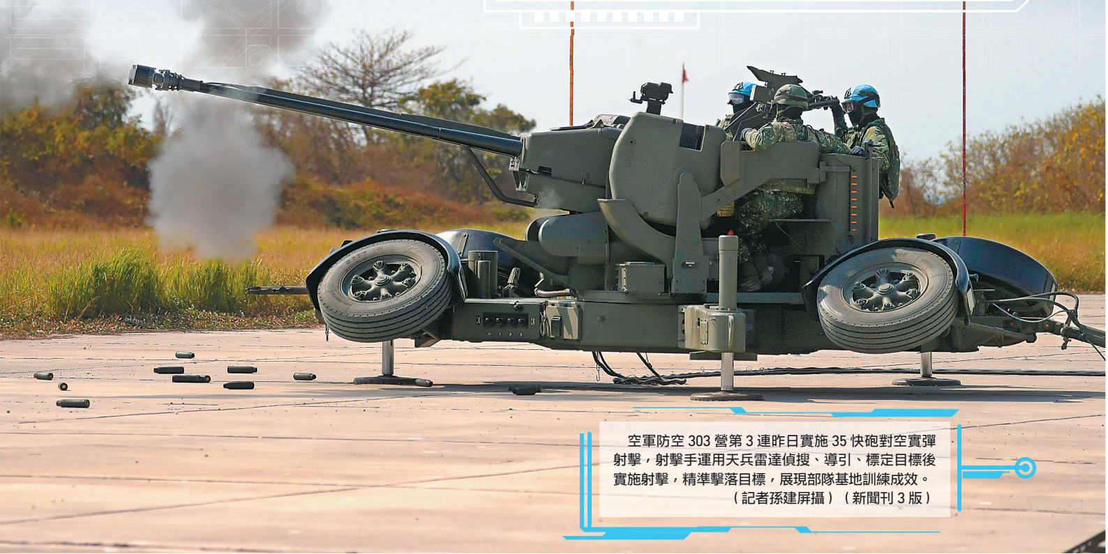
空軍防空 303 營第 3 連昨日實施 35 快砲對空實彈射擊，射擊手運用天兵雷達偵搜、導引、標定目標後實施射擊，精準擊落目標，展現部隊基地訓練成效。 (新聞刊 3 版)