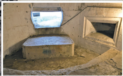
◆◆ 山水30高地早期曾是軍事管制區，迄今仍保留軍事原始風貌。