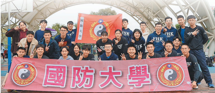
國防大學定向越野代表隊參加「113年桃園市運動會定向越野錦標賽」，繳出亮眼成績單，為校爭光。

終場在所有選手團結努力及穩定表現下，抱回男子團體冠軍獎盃及女子團體亞軍獎盃，驗證平日努力訓練成果，實至名歸；未來代表隊也將秉持永不放棄的堅定信念，持續在運動賽事中爭取佳績，用運動展現信心。