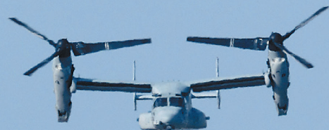
美軍在普天間基地的MV-22B「魚鷹」，停飛數月後終於再次升空執行任務。

至於日本陸上自衛隊的14架「魚鷹」機隊，也將採類似方式，先在駐地不更津基地周邊飛行，讓機組人員驗證機體狀況、熟悉飛行操作，再考慮是否逐漸恢復一般戰訓任務。