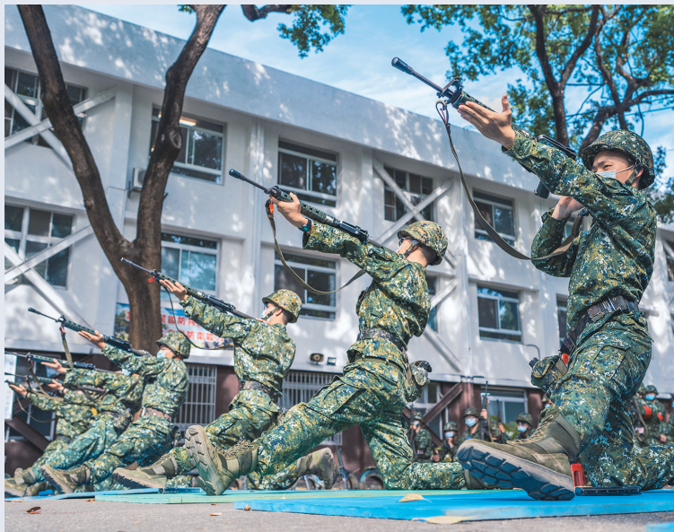
▲1年期義務役不僅延長服役時間，更強化義務役士官兵的訓練，希望透過部隊遴選分發、精實訓練內涵，進一步奠定我國防衛戰力基礎。（本報資料照片）

此外，義務役役男在駐地訓練期間，還會實施民防任務訓練，課程包括民防通識、民防專業、救護訓練、災害搜（搶）救。其中在民防通識部分，預計有全民國防、民防基礎常識，民防專業部分有基礎防禦、防空避難、災情蒐報，救護訓練部分有初／中級救護技術員課程、心肺復甦術、傷患運送等，災害搜（搶）救部分，則有基礎搜救、緊急救護、災害搶救、防