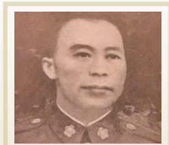
戴之奇將軍參與抗日及剿共，為國壯烈犧牲，臨難不屈，充分發揚黃埔精神。

抗戰勝利後，戴之奇升任整編第69師中將師長，駐防江蘇宿遷。民國35年12月適逢共軍竄擾蘇北，戴之奇奉命進剿，遭頑強抵抗，仍身先士卒，浴血奮戰5晝夜，因後繼無援，但共軍採人海戰術猛攻不已，導致傷亡劇增，戴之奇沉著應戰。18日夜，敵衝入我軍指揮所，戴之奇自知戰局已無可挽救，乃拔槍自戕成仁，壯烈犧牲，享年42歲。政府特明令褒揚，優予撫卹。