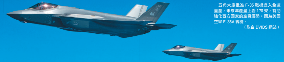
五角大廈批准 F-35 戰機進入全速量產，未來年產量上看 170 架，有助強化西方國家的空戰優勢。圖為美國空軍 F-35A 戰機。

希臘空軍 332 中隊預計在本月底前完成 24 架「颶風」全機隊裝裝，目前其已具備空地勤人員訓練認證，待機隊到齊，就能達全作戰能力（FOC）。