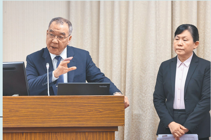
→ 邱部長出席立法院外交及國防委員會專案報告，並備質詢。

此外，為反制中共認知作戰，國防部聯合專案編組快速反應制變，主動注蒐爭議訊息外，運用青年日報、軍聞社及漢聲電臺等專業能量，透過正向文宣策略，鞏固國人及官兵心防；針對各項錯假訊息，建立反制認知作戰應處機制，依追根溯源、查證、損害評估與澄清等方式反制，防杜不實資訊擴散。