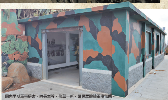
園內早期軍事房舍、哨長室等，修葺一新，讓民眾體驗軍事氛圍。