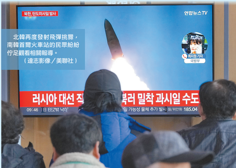
北韓再度發射飛彈挑釁，南韓首爾火車站的民眾紛紛佇足觀看相關報導。

為參與美韓外長會、提早於 17 日抵達的美國務卿布林肯，18 日出席民主峰會時，批評獨裁者和專制政權利用科技破壞民主和人權，並宣示美方將與南韓並肩合作，以堅決態度回應北韓挑釁舉措，並強調將進一步攜手盟友強化嚇阻力量，維護朝鮮半島的和平穩定局勢。