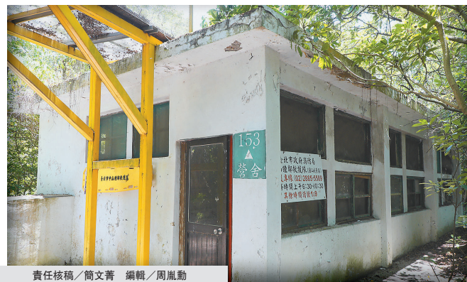
責任核稿/簡文菁 編輯/周胤勳