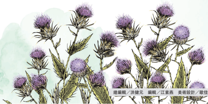
總編輯/洪健元 編輯/江素燕 美術設計/歐佳萍

買了兩盆重瓣大岩桐，這花原長在森林的林床下，需光性不高，放在窗邊，每天看個幾回，結花苞了，啊！全都爆花了，萬紫千紅總是春，一盆紫、一盆紅就把窗台妝點成美麗的春天。