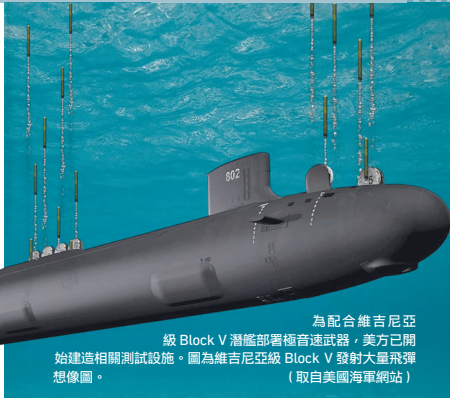
為配合維吉尼亞級 Block V 潛艦部署極音速武器，美方已開始建造相關測試設施。圖為維吉尼亞級 Block V 發射大量飛彈想像圖。

報導說，LRHW 不會配備核彈頭，其會在大氣層上端的淺層軌道，以 5 馬赫以上的速度飛行，並結合彈道飛彈的速度和巡弋飛彈的機動性，可在短時間內，打擊數千公里以外的目標。且採取潛射方式，可進一步發揮極音速武器的高速性能，穿透共軍可能的防空網，打擊指管中心等關鍵資產，藉「序戰齊射」（opening salvo）效果，打破敵方「反介入／區域拒止」（A2AD）能力，以利後續二方機艦進入戰區。