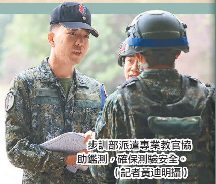
步訓部派遣專業教官協助鑑測，確保測驗安全。