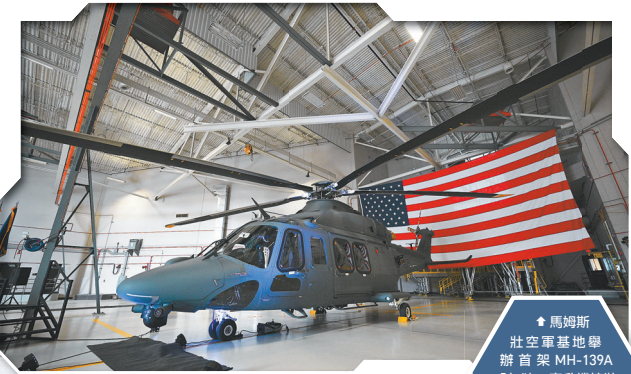
◆ 馬姆斯壯空軍基地舉辦首架 MH-139A「灰狼」直升機接裝儀式。