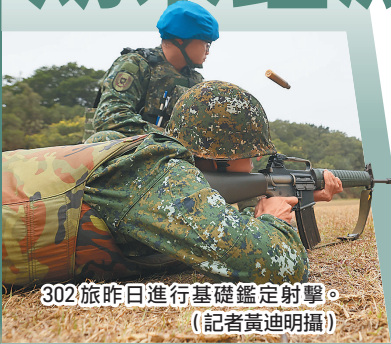
302旅昨日進行基礎鑑定射擊。