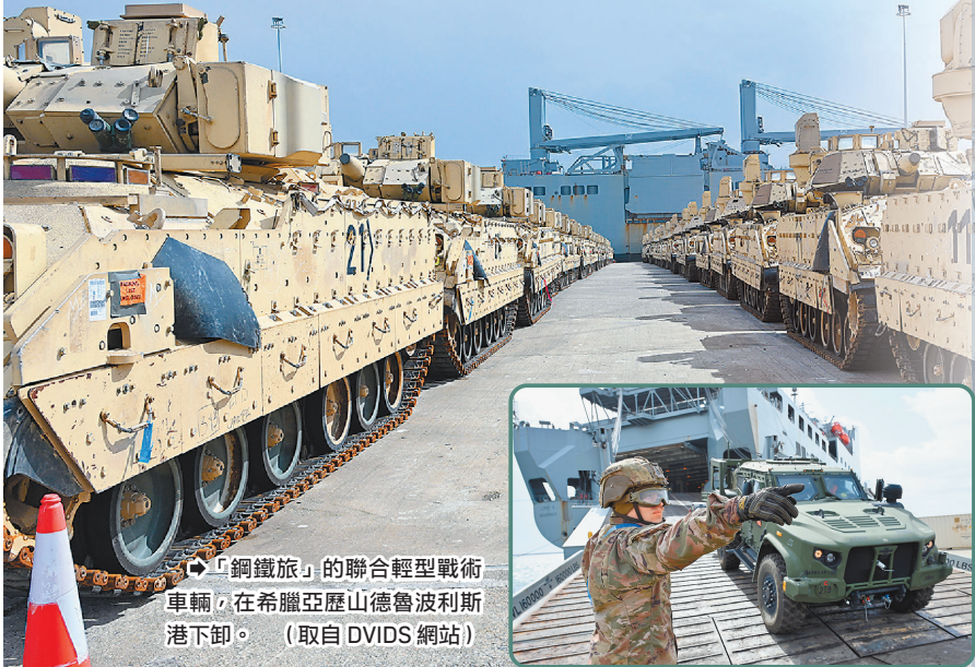
「鋼鐵旅」的聯合輕型戰術車輛，在希臘亞歷山德魯波里斯港下卸。