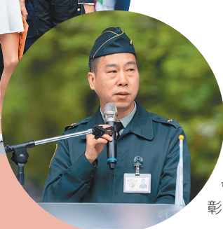
政戰學院院長謝少將主持第15屆復興崗藝術季開幕活動，期許透過活動，展現軍校生藝術軟實力。