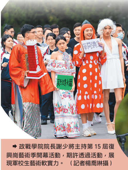
政戰學院第15屆復興崗藝術季開幕活動，展現學生多元創作能量。