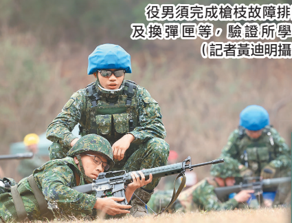
役男須完成槍枝故障排除及換彈匣等，驗證所學。