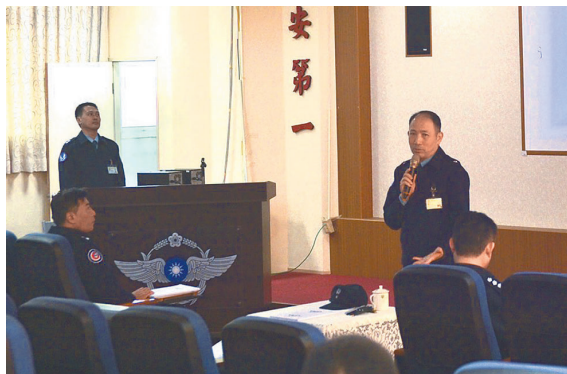
空軍司令部副參謀長謝少將日前主持敵情專題巡迴講習，建構堅實戰力。

戰役回顧、當前區域情勢與敵情威脅，就單位任務及特性審慎思考，發展適切之戰術戰法，使所屬充分了解所負任務，熟悉敵情與作戰環境，以肆應未來作戰需求。