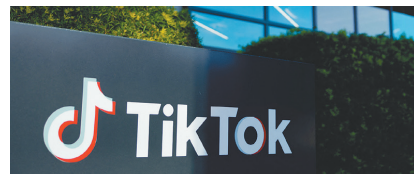
相關研究指出，TikTok 的獎勵機制形同鼓勵平臺用戶，製造與散布聳動吸睛的假訊息與陰謀論。

李查茲形容，賦予高度吸睛且製作成本低廉的內容經濟激勵，無疑讓 TikTok 成為陰謀論大行其道的溫床。