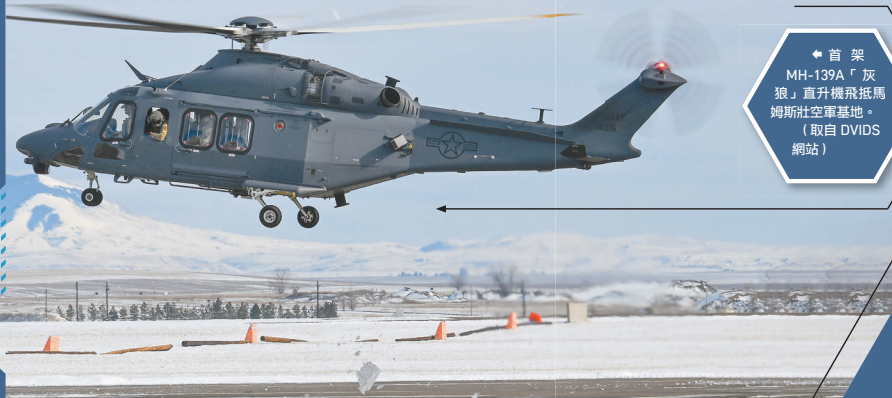
◆ 首架 MH-139A「灰狼」直升機飛抵馬姆斯壯空軍基地。

美國《空軍與太空雜誌》報導則說，鑑於財政壓力與 UH-1N 的剩餘壽命考量，美國空軍已在最新公布的 2025 財年預算需求書中，將 MH-139A 的計畫採購數字下修為 36 架（另有 6 架原型機），其中 3 座洲際飛彈基地依原定計畫各獲得 11 架 MH-139A，另外 3 架則部署在阿拉巴馬州麥克斯威爾空軍基地作為換訓機，至於安德魯、橫田等地則暫不部署。