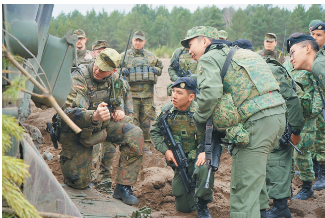
德軍教官指導星國官兵下車戰鬥技巧，強化作業互通性。

星德年度「裝甲打擊」聯演自 2009 年起，每年分春、秋兩次進行，藉此加強星德裝甲部隊作業互通性與作戰能力，同時透過各式交流活動與會談，強化德國與印太盟邦之間合作關係。