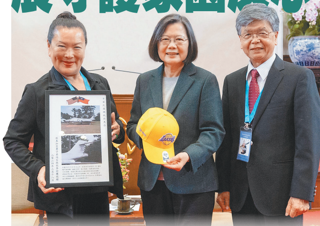
蔡總統昨日接見「中華民國113年旅美加空軍子弟返臺致敬參訪團」。