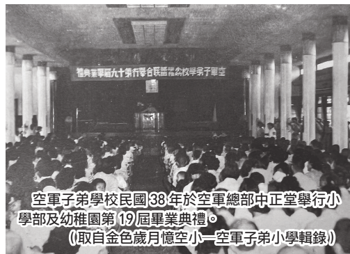
空軍子弟學校民國38年於空軍總部中正堂舉行小學部及幼稚園第19屆畢業典禮。

民國54年，國防部計畫將自辦學校移交地方政府，並決議於民國56年前將各空小全數移交，改制後之校名考量各校性質及歷史背景，以空軍英雄先烈名字或其他有意義的名稱命名。民國55年4月7日，空軍正式公告臺北懷生、桃園陳康、新竹戴熙、臺中省三、嘉義志航、虎尾拯民、臺南志開、岡山兆湖、筓橋、屏東鶴聲、東港以栗、花蓮鑄強及宜蘭南屏等13個校名。民國55年及56年8月1日，分批移交由地方政府接辦，自此，空軍子弟小學正式走入歷