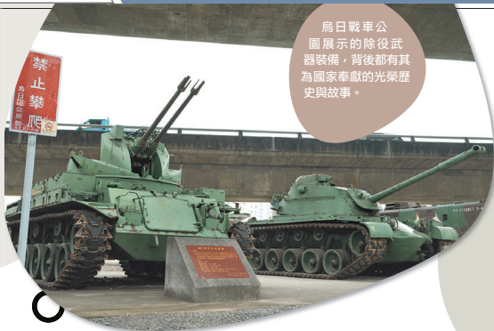
烏日戰車公園展示的除役武器裝備，背後都有其為國家奉獻的光榮歷史與故事。