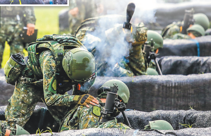
→ 新北市後備旅實施 60 迫砲訓練彈射擊訓練，精進召員專長複訓與臨戰訓練之綜效。 (記者楊喬琳攝)