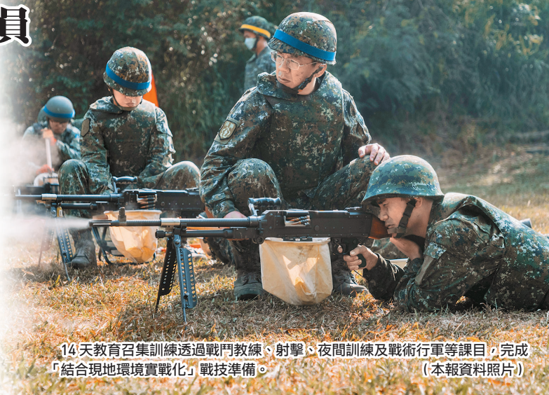
14天教育召集訓練透過戰鬥教練、射擊、夜間訓練及戰術行軍等課目，完成「結合現地環境實戰化」戰技準備。(本報資料照片)

全民防衛韌性是守護家園，抵禦敵人入侵的必要條件，面對中共企圖以武力片面改變臺海現狀，威脅國家安全，全體國人更要展現出團結一心、守護家園的決心；透過全民共同參與、政府與民