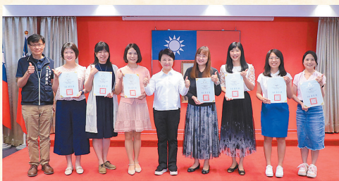
↑ 今年獲選的 7 名優秀教師合照