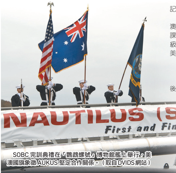
SOBC 完訓典禮在「鸚鵡螺號」博物館艦上舉行。美澳國旗象徵AUKUS堅定合作關係。