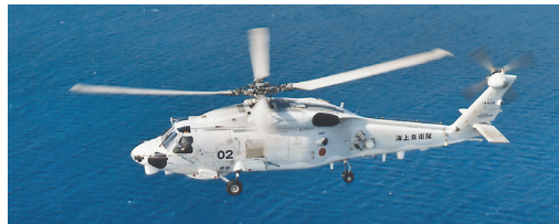
海自幕僚長海井良海將則說，目前排除他國涉及該起事故的可能性，除全力搜尋失聯 7 名隊員，並由海上幕僚監部成立事故調查委員會，著手調查事故原因。

對此，木原稔 21 日凌晨舉行緊急記者會，證實 2 架分屬德島縣小松島航空基地及長崎縣大村航空基地的直升機，不幸墜毀；同日上午再宣布，尋獲 1 名機組員遺體，並在失事地點附近發現主旋翼葉片及部分機體零件，由於尋獲的 2 具黑盒子距離相近，初步研判「2 架直升機有可能在空中相撞」。