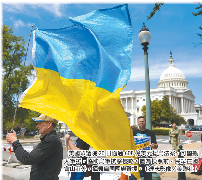
美國眾議院 20 日通過 608 億美元援烏法案，可望擴大軍援協助烏軍抗擊侵略。圖為投票前，民眾在國會山莊外揮舞烏國國旗聲援。

報導分析，儘管該項由拜登和民主黨國會議員主導的援烏計畫，曾因朝野內部對規模與援助方式存在歧見而拖延數月，經眾議院議長強生斡旋，最終順利通過，可望使近期屈居守勢的烏軍獲得更多武器裝備，有效抵禦俄軍進犯。