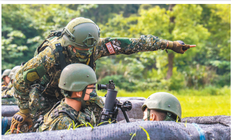
↑ 召員在教官細心指導下，依序完成諸元校正、射向賦予等射擊流程。