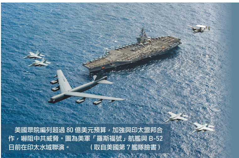
美國眾院編列超過 80 億美元預算，加強與印太盟邦合作，嚇阻中共威脅。圖為美軍「羅斯福號」航艦與 B-52 日前在印太水域聯演。