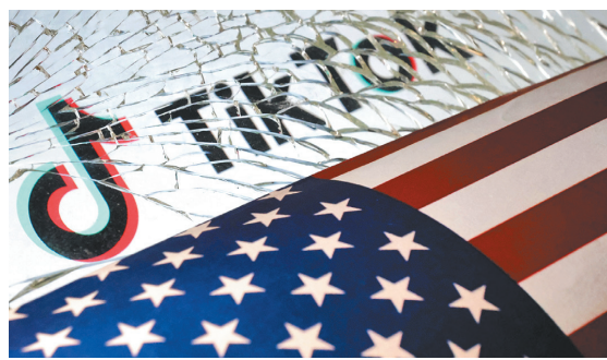
↑TikTok 再遭美國國會施壓，要求「字節跳動」全面撤資。

美國國會持續向 TikTok 與「字節跳動」施壓，是基於憂慮該公司將大量美國用戶資訊提供給北京，同時也希望藉此防堵中共運用社群媒體製造假訊息，進而有效維護美國國家安全。