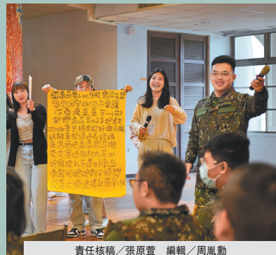
責任核稿／張原萱 編輯／周胤勳

→機步 269 旅舉辦 113 年反毒宣教活動，並邀請林口長庚醫院急診醫學科團隊幫助官兵認識毒品的危害。(機步 269 旅提供)