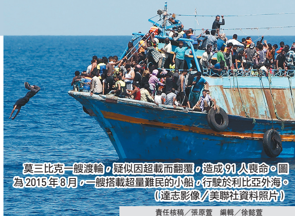
莫三比克一艘渡輪，疑似因超載而翻覆，造成 91 人喪命。圖為 2015 年 8 月，一艘搭載超量難民的小船，行駛於利比亞外海。

據聯合國兒童基金會（UNICEF）資料顯示，非洲南部地區現正經歷過去 25 年來，最為嚴重的霍亂疫情，且已蔓延至該區鄰近多個國家；而自去年 10 月以來，莫國已通報 1 萬 3700 例確診與 30 例死亡病例。