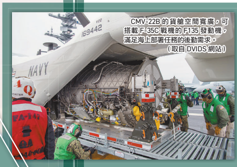
CMV-22B 的貨艙空間寬廣，可搭載 F-35C 戰機使用的 F135 發動機，滿足海上部署任務的後勤需求。

MARTAC 公司推出 Muskie M18 小型自主水面載具，可用於執行偵偵與水面打擊任務。