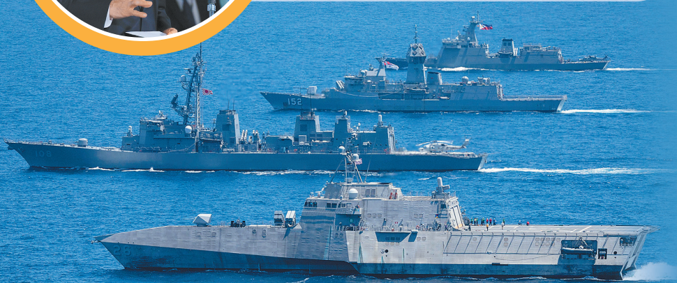
美日澳菲 4 國艦艇於 7 至 8 日在菲律賓專屬經濟海域舉行聯演，藉此宣示加強合作、嚇阻中共威脅的決心。