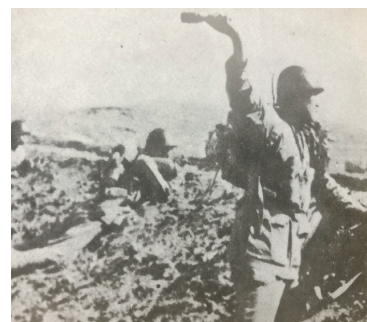
官兵投擲手榴彈，阻擊進犯日軍。