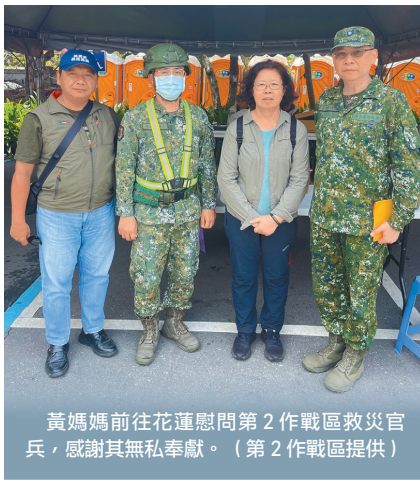
黃媽媽前往花蓮慰問第2作戰區救災官兵，感謝其無私奉獻。

「對國軍我只有滿滿的感謝。」黃媽媽說，官兵也是年輕人，他們的家人一定也會感到擔心，但國軍總是義無反顧，因此，希望部隊能多注意官兵安全與身體狀況，也期望透過自己一點小小心意，鼓勵國軍，讓社會大眾看見國軍付出，並不吝給予肯定，團結齊心共創美好家園。