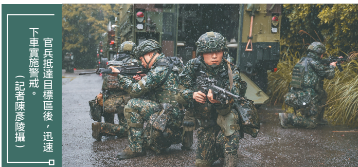
官兵抵達目標區後，迅速下車實施警戒。