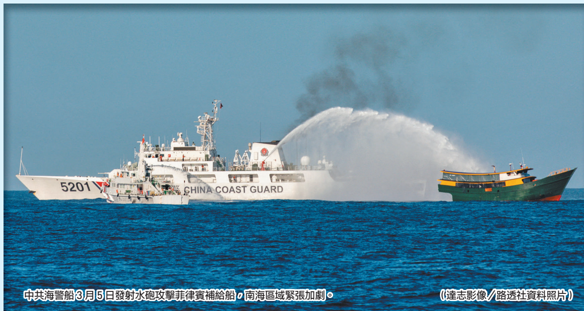
中共海警船3月5日發射水砲攻擊菲律賓補給船，南海區域緊張加劇。

菲律賓認為南海是自由開放的，面對中共在南海強勢作為，該國強化與其他國家的國防軍事結盟。除美菲同