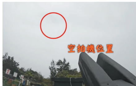
責任核稿/林忠和 編輯/吳亭秀

此外，「中華民國陸軍」臉書專頁亦發布干擾槍反制實況影片(如下圖)及發射信號彈示警照片，並表示金防部將持續監控、嚴密掌握，並立即做好應處作為。