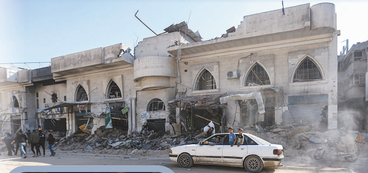
▲ 以軍撤離汗尤尼斯後，留下大量斷垣殘壁。

以色列與哈瑪斯均證實，談判代表已抵達埃及展開新一輪協商，而美國中央情報局（CIA）局長伯恩斯也於 6 日率先到達當地，目前各界都希望停火談判能有所進展，減緩加薩持續加劇的人道危機。