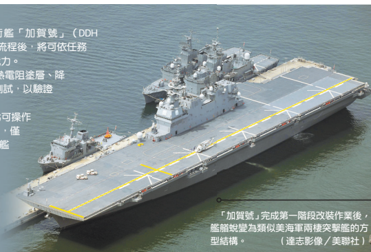
「加賀號」完成第一階段改裝作業後，艦艏蛻變為類似美海軍兩棲突擊艦的方型結構。

航空自衛隊將自今年起接收 F-35B 戰機，但日本憲法不允許保有「攻擊型航空母艦」，因此，機隊未來仍將以九州宮崎縣的新田原基地作為固定駐地，而 F-35B 戰機僅會視任務需求，在「出雲號」與「加賀號」執行短期彈性部署。