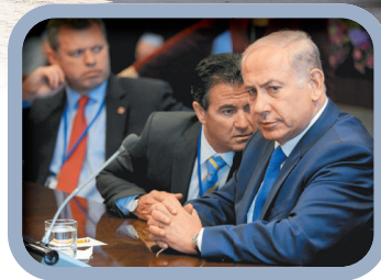
▲ 以軍自加薩南部撤離，恐凸顯尼坦雅胡正面臨國內外巨大壓力。