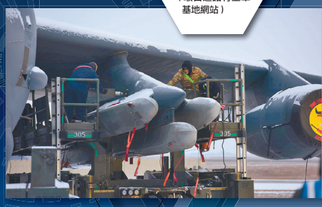
完成裝掛與機務整備後，B-52H 轟炸機可隨時飛往全球執行任務。

美國空軍全球打擊指揮部 (AFGSC) 表示，該系列演訓目標在於驗證轟炸機隊的打擊能量，而不同單位的搭配合作，不僅能強化作業互通性，也展現美軍執行快速投射任務、維護全球和平穩定的具體承諾。