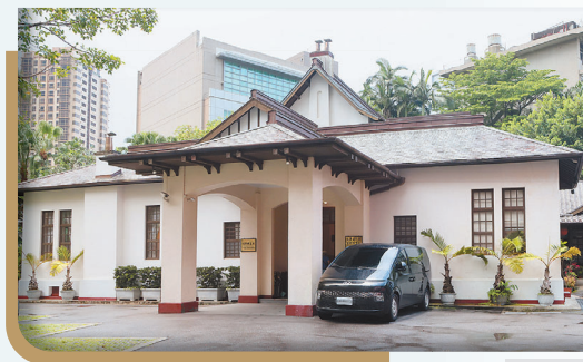
後人可藉由參觀「孫立人將軍官邸」，緬懷其對國家安全的卓越貢獻。