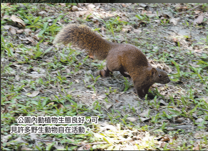
公園內動植物生態良好，可見許多野生動物自在活動。