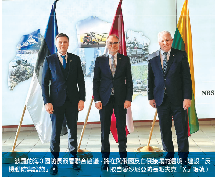
波羅的海3國防長簽署聯合協議，將在與俄國及白俄接壤的邊境，建設「反機動防禦設施」。

同日，3國防長也針對採購M142「高機動砲兵火箭系統」(HIMARS)的意向書簽署協議，並討論援助烏克蘭計畫，預計將在7月於美國舉行的北約峰會上，做出更多具體承諾。