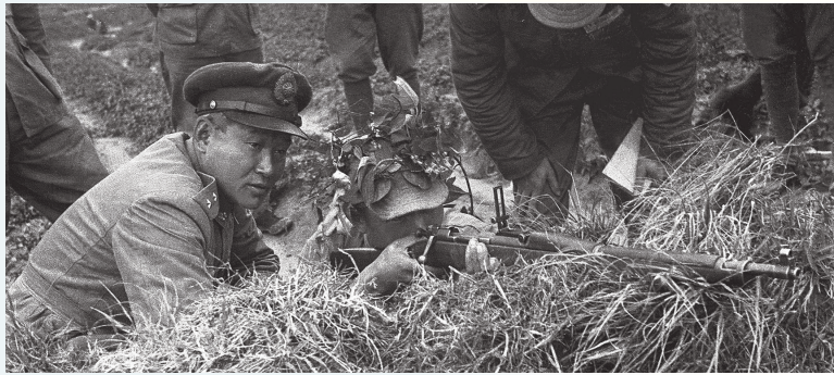
孫立人將軍親自督訓部隊，尤其重視基本射擊訓練與武器操作。青年軍第 201 師鳳山整訓，練就精準槍法，在古寧頭戰役發揮戰力。

為紀念其偉大貢獻，「孫立人將軍官邸」展示孫將軍生平歷史介紹，追思其對國家的卓越付出。該官邸是一幢具有百年歷史的市定古蹟，曾作為陸軍訓練司令官邸、臺灣防衛司令官邸及陸軍總司令官邸，孫將軍在擔任陸軍總司令時曾經入住。值得一提的是，孫將軍曾在此官邸接受第一任美國駐臺大使司徒雷登代表羅斯福總統，授予其豐功勳章。後人可藉由參觀官邸及其內部設置的老照片，緬懷其對國家安全的卓越貢獻。