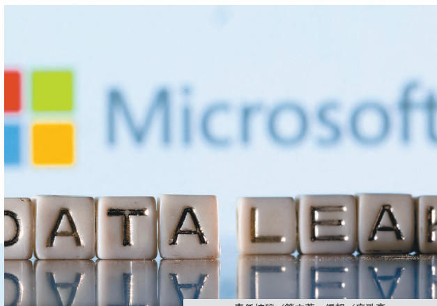
責任核稿／簡文菁 編輯／廖勁豪

微軟遭俄國家級駭客組織攻擊，部分員工電郵等資料遭竊。