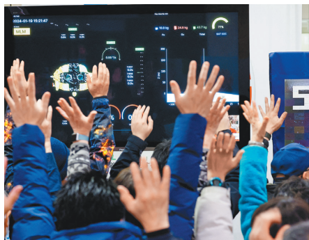
日本自製 SLIM 無人探測器，19 日著陸月球瞬間，JAXA 研究中心人員歡欣鼓舞。