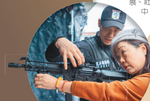
透過靜態裝備陳展與體驗，使嘉賓深入了解憲兵部隊裝備性能。