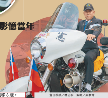
小啟：今日精撰，「致敬典範」專欄移6版。

昨日部慶活動現場陳展除的山葉「皇家之星」重機，並提供現場嘉賓體驗中服穿著，且能坐上「皇家之星」拍照留念，吸引不少過往在機車連(快速反應連前身)服役的前輩們躍躍欲試，紛紛上前與當時「老戰友」合影，回憶往昔軍旅歲月。