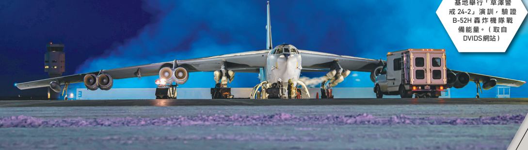
美軍本月初在邁諾特空軍基地舉行「草澤警戒 24-2」演訓，驗證 B-52H 轟炸機隊戰備能量。