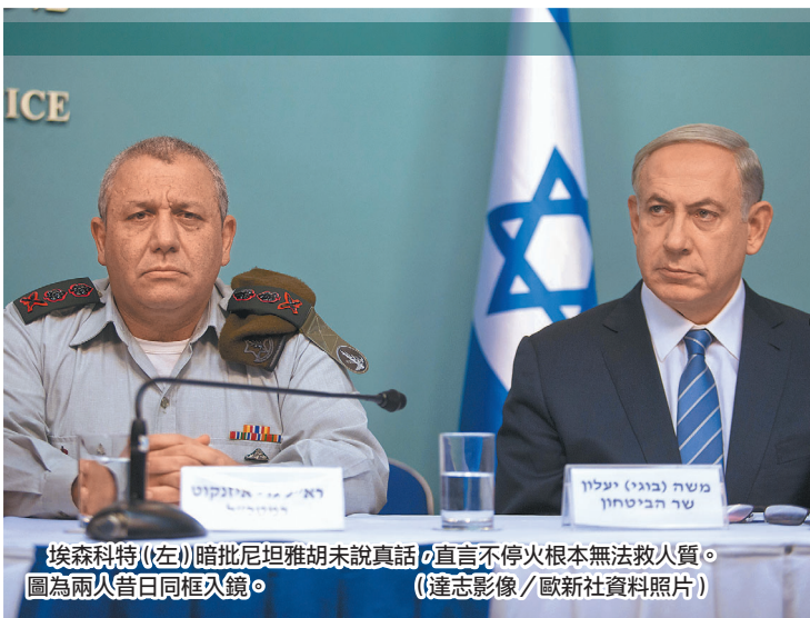
埃森科特(左)暗批尼坦雅胡未說真話，直言不停火根本無法救人質。圖為兩人昔日同框入鏡。