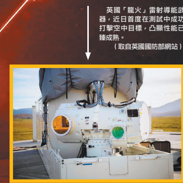
英國「龍火」雷射導能武器，近日首度在測試中成功打擊空中目標，凸顯性能已臻成熟。