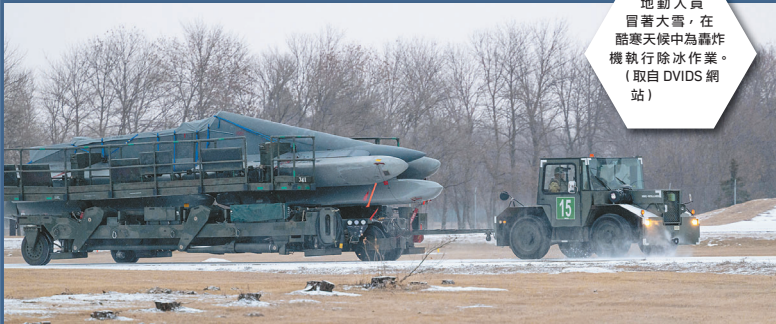
地勤人員冒著大雪，在酷寒天候中為轟炸機執行除冰作業。