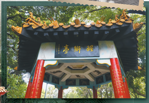
介壽公園屬中式庭園設計，園內醒獅亭為琉璃黃瓦、紅柱。