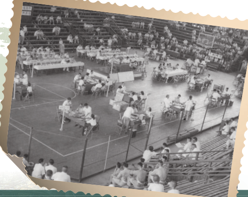
1950年代臺北市電話裝機抽籤在當時的三軍球場舉辦。