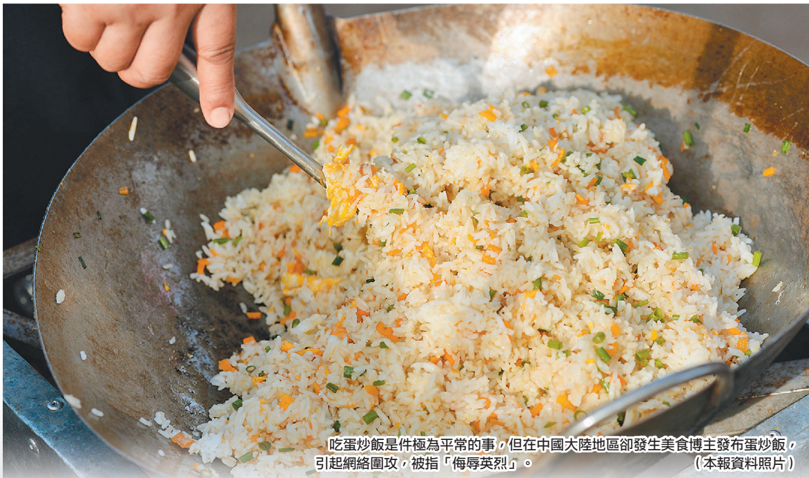
吃蛋炒飯是件極為平常的事，但在中國大陸地區卻發生美食博主發布蛋炒飯，引起網絡圍攻，被指「侮辱英烈」。（本報資料照片）

1951年5月15日，美國參謀長聯席會議主席布萊德利將軍在國會議證會上提到，「從參謀長聯席會議的觀點來看，這個策略（指將戰事從韓國擴大到包括中國大陸）會讓我們在錯誤的地點、錯誤的時間，與錯誤的敵人進行錯誤的戰爭。」因為在歐洲應對蘇聯擴張，才是美國戰略重心。當時，毛澤東除派「志願軍」到北韓參戰，還派出他的長子毛岸英參戰。毛澤東派毛岸英參戰有2個目的，其一是支持北韓金日成政權；另一則在向