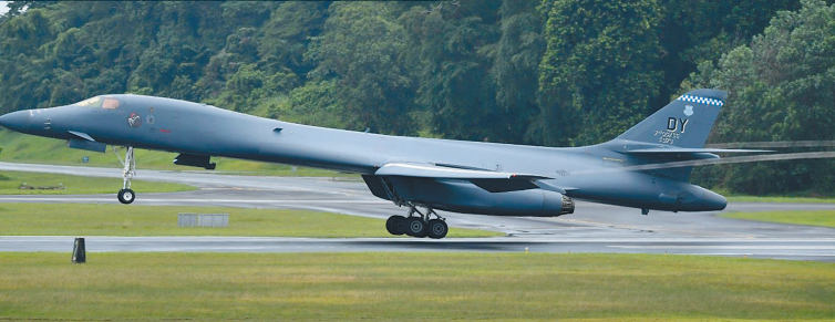
美軍 B-1B 轟炸機 18 日飛抵新加坡，將與星國空軍加油機展開聯演。