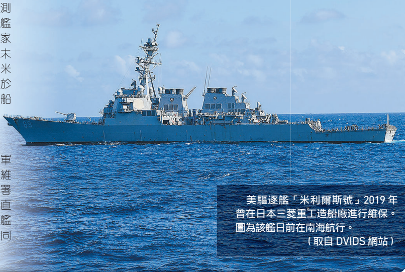
美驅逐艦「米利爾斯號」2019 年曾在日本三菱重工造船廠進行維保。圖為該艦日前在南海航行。

報導分析，這項計畫不僅能提升美軍應對印太威脅能力，也有助解決美軍維修量能不足的問題。美國政府問責署(GAO) 2022 年 5 月曾發布報告，直指水面艦維修量能不足，已使部分軍艦服役壽命縮短。而未來可望透過美日同盟合作，帶來「正面改變」。