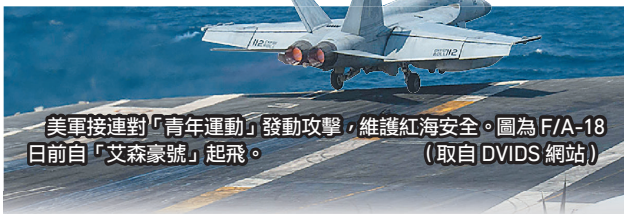
美軍接連對「青年運動」發動攻擊，維護紅海安全。圖為 F/A-18 日前自「艾森豪號」起飛。