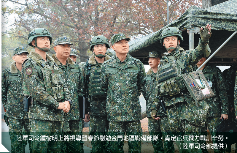
陸軍司令鍾樹明上將視導暨春節慰勉金門地區戰備部隊，肯定官兵戮力戰訓辛勞。

鍾司令亦叮囑幹部，應完善官兵生活照顧，主動協助下級解決窒礙，提升所屬對單位的認同，凝聚向心；同時頒發團體加茶金，與每位官兵握手致意，激勵士氣，肯定其堅守崗位的辛勞與付出，是奠定防區安全不可或缺的基石，更使敵不敢輕越雷池，確保國家安全。