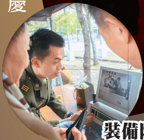
活動現場有「指紋採集」及「假鈔辨識」體驗攤位，使嘉賓切身體會憲兵專業案件的偵辦能力。