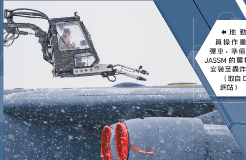
地勤人員操作重型掛彈車，準備將掛有 JASSM 的翼根掛架，安裝至轟炸機上。