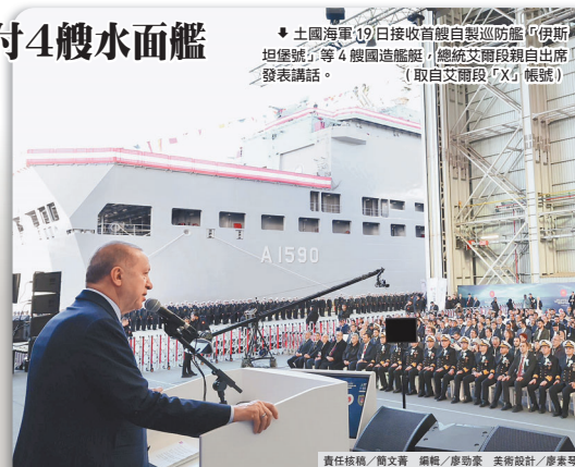
責任核稿／高文青 編輯／廖功家 美術設計／廖學琴