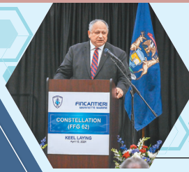
美國海軍部長德爾托羅 12 日出席星座級巡防艦首艦「星座號」安放龍骨儀式。