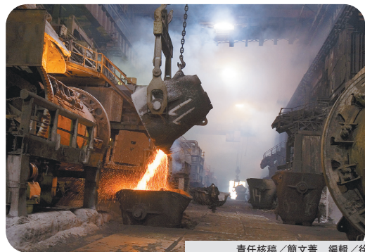
美英聯手對俄國鋁銅鎳祭出新制裁。圖為俄國一座煉銅廠。

美國「彭博社」指出，俄羅斯為鋁、銅和鎳的主要生產國，約占全球產量的5%、銅產量約4%，而鎳產量則約6%；尤其占倫敦金屬交易所的貿易量很大一部分。截至3月底，LME的庫存鋁有91%來自俄國、銅則占62%，鎳有36%。