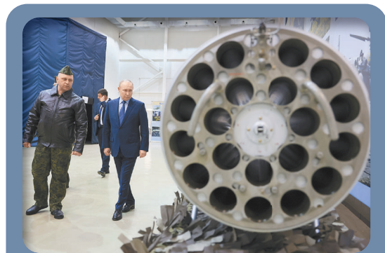
俄國在中共幫助下，正積極重振軍工產能，持續侵烏。圖為俄總統蒲亭（左2）日前視察第344飛行員作戰應用和再培訓中心。