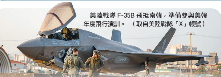
美陸戰隊 F-35B 飛抵南韓，準備參與美韓年度飛行演訓。