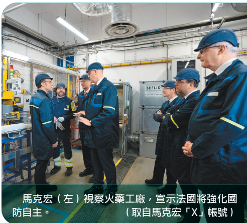
馬克宏（左）視察火藥工廠，宣示法國將強化國防自主。

「Eurengo」在瑞典、比利時與美國都設有子公司，該公司製造的火藥，用於歐洲多國使用的炸彈、火箭、魚雷、砲彈或中型口徑槍彈等武器，如今重返法國生產，凸顯烏俄戰爭導致的歐洲安全局勢變化，使傳統軍工業重獲重視，有助確保各國國防自主性。