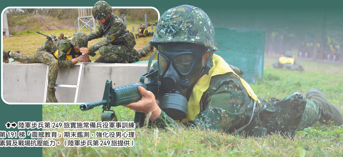
陸軍步兵第249旅實施常備兵役軍事訓練第191梯「震撼教育」期末鑑測，強化役男心理素質及戰場抗壓能力。

旅長許上校表示，震撼教育鑑測藉各項綜合演練，磨練官兵戰鬥技能及戰場臨場應處能力，以逐步提升部隊整體戰力。