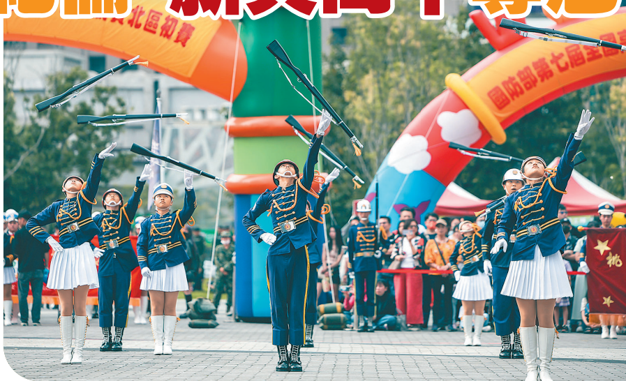
↑ 新興高中槍法精湛整齊，於競賽中拔得頭籌。

此外，為強化全民國防教育，現場也設置未爆彈處理小組裝備陳展、戰車模擬器、特戰傘具穿戴體驗等軍事體驗攤位，讓民眾可以近距離接觸國防事務，除認識國軍、了解國軍，更進一步支持國防事務。