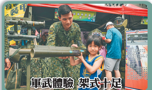
軍武體驗 架式十足

昨日北區初賽，除了各校儀隊表演外，國軍也在現場設置體驗攤位，其中，民眾在官兵的協助下，穿上近20公斤的跳傘傘具，直呼「真的好重！」，也從中體會到國軍官兵訓練的扎實與不易。