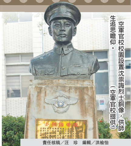
空軍官校校園設置沈崇誨烈士銅像，供師生追思瞻仰。

抗戰期間，國軍官兵英勇作戰，扭轉敵強我弱劣勢，保衛中華民國的生存與主權，空軍在其中發揮重要角色，成功擔負起捍衛領空的神聖使命。撫今追昔，除感念先烈有我無敵之精神，國軍官兵也有絕對信心承先啓後，承擔保家衛國重任。