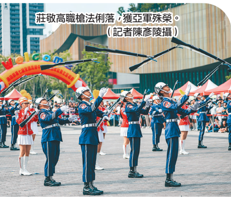
莊敬高職槍法俐落，獲亞軍殊榮。